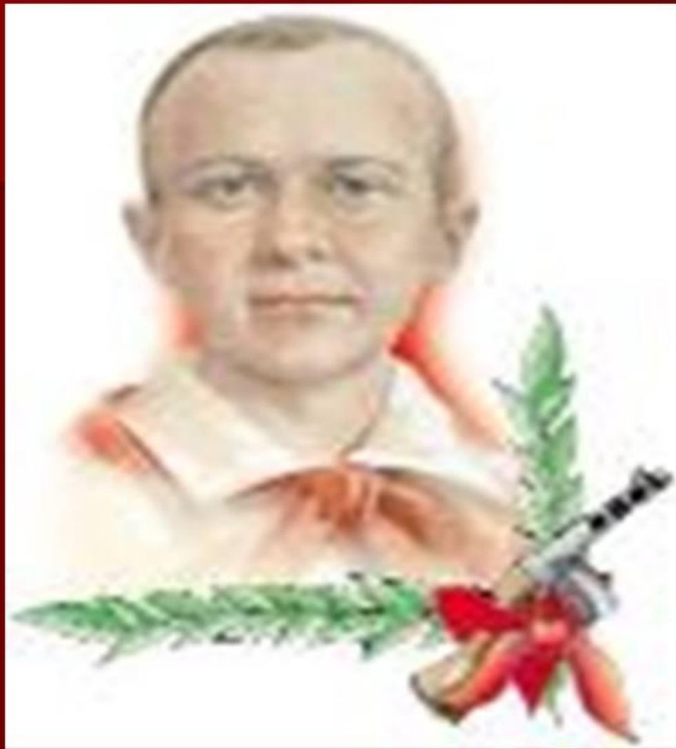
Марат Казей- герой Советского Союза