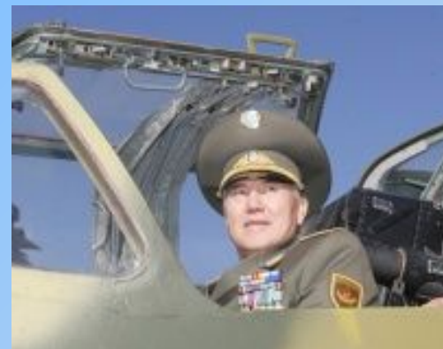
Верховный главнокомандующий Вооруженными Силами Республики Казахстан