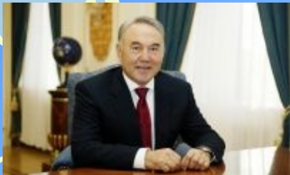
Первый Президент Республики Казахстан – Елбасы (Лидер нации)