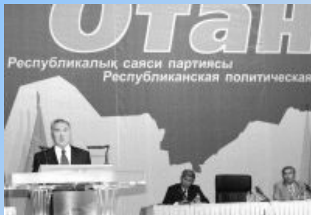
Председатель Народно-демократической партии «Нур Отан»