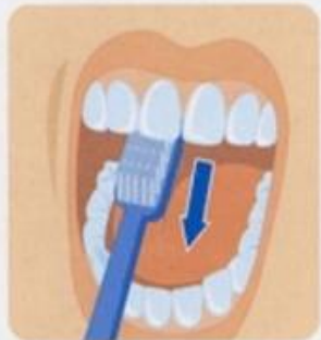
3. Внутренние поверхности передних зубов