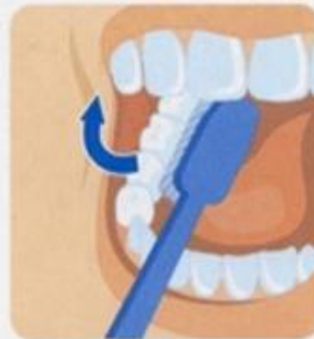
2. Внутренние поверхности зубов