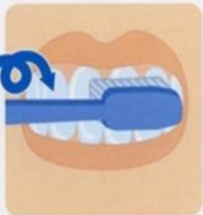
5. Массаж десен