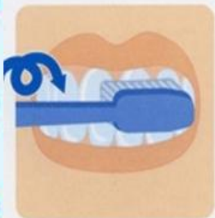
5. Массаж десен