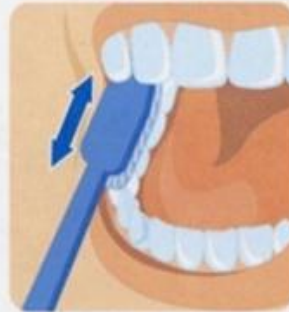
4. Жевательная поверхность зубов