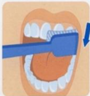
1. Наружные поверхности зубов