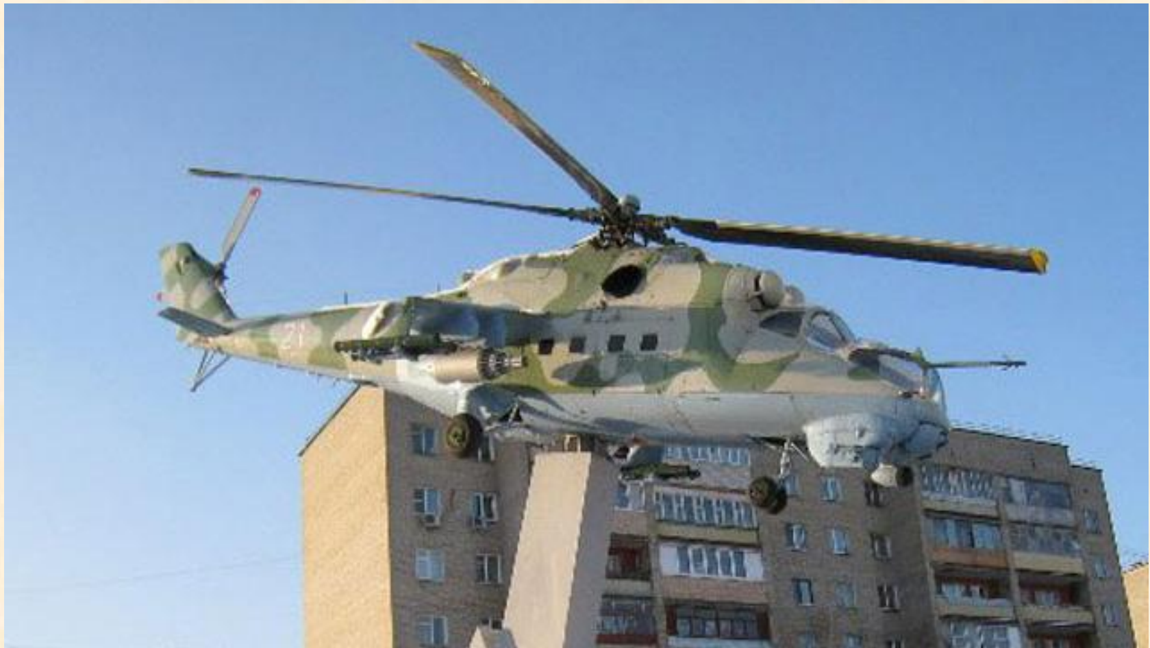
Памятник вертолету МИ – 24. Открыт 9 февраля 2009 года.