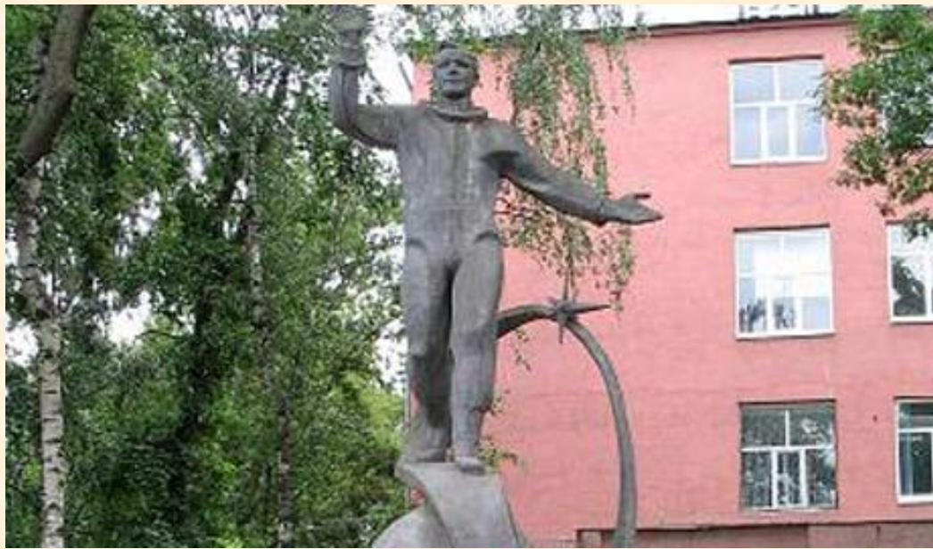
Памятник Юрию Алексеевичу Гагарину