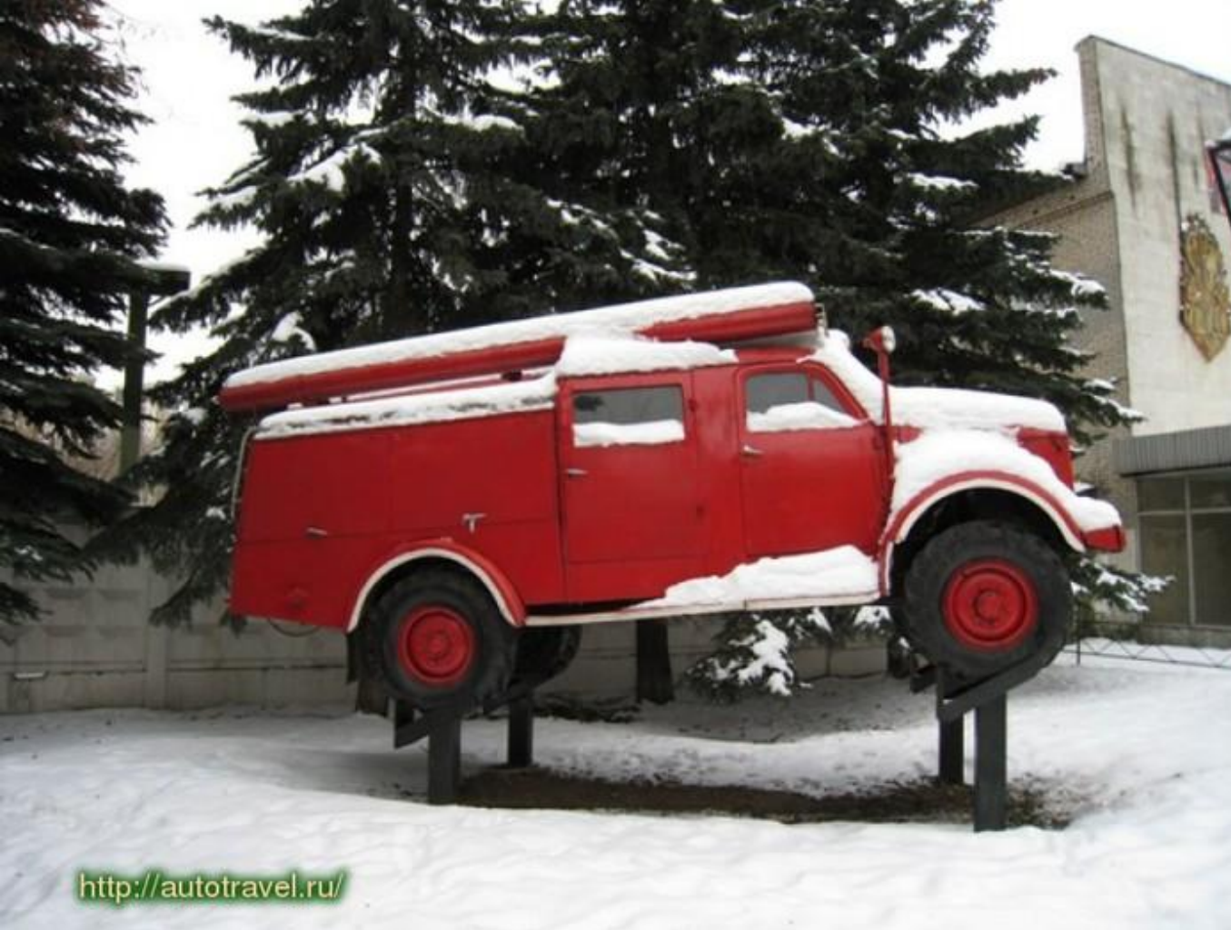
Памятник пожарной машине в Люберцах