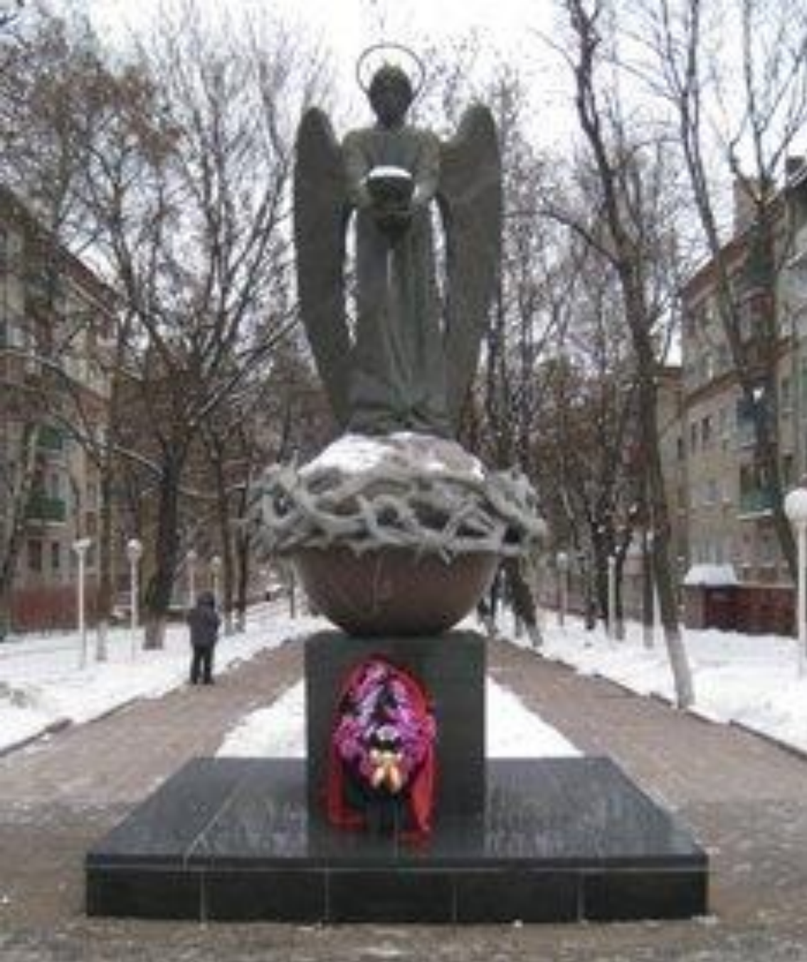
Памятник Ангелу - хранителю