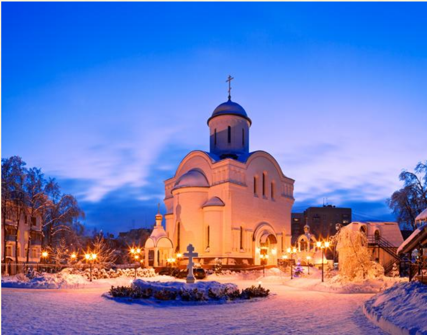
Храм Преображения Господня