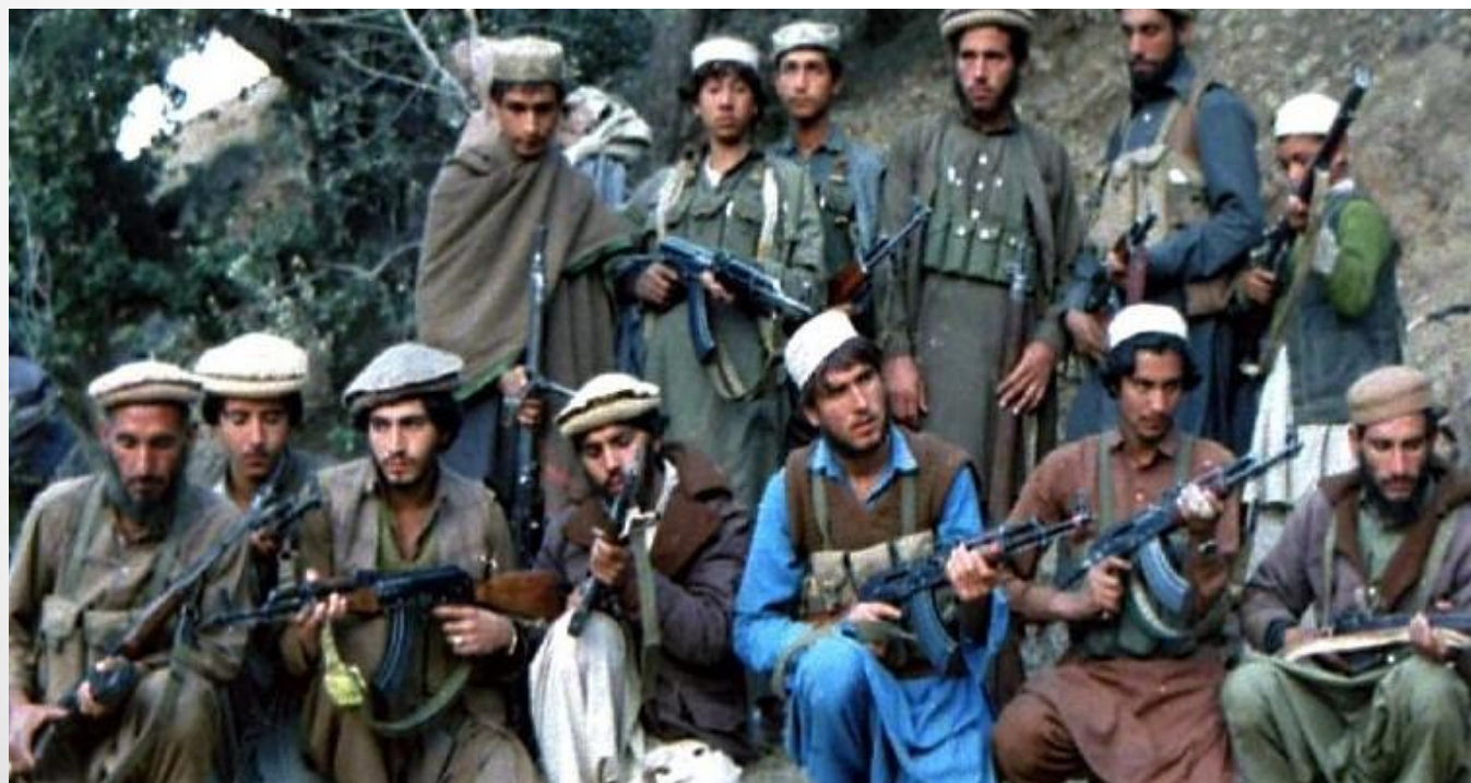
Ауғанстан Ислам партиясының моджахедтері, 1987 жыл.

Бұл “қырғи қабақ соғыс” кезеңі өткеннен кейінгі уақытта да КСРО-ның өзге елдерді өз ықпалына қарату саясатының айқын көрінісі еді. 1965 ж. қаңтарда Ауғанстанда Кеңес Одағы Мемлекеттік қауіпсіздік комитеті (МХК) тыңшыларының қатысуымен жартылай астыртын қызмет атқарған халықтық-демокр. партия (ХДП) құрылып, біраздан соң ол екіге бөлінген. “Халк” тобын Н.М. Тараки, Х.Амин, ал “Парчам” тобын Б.Кармаль басқарды.