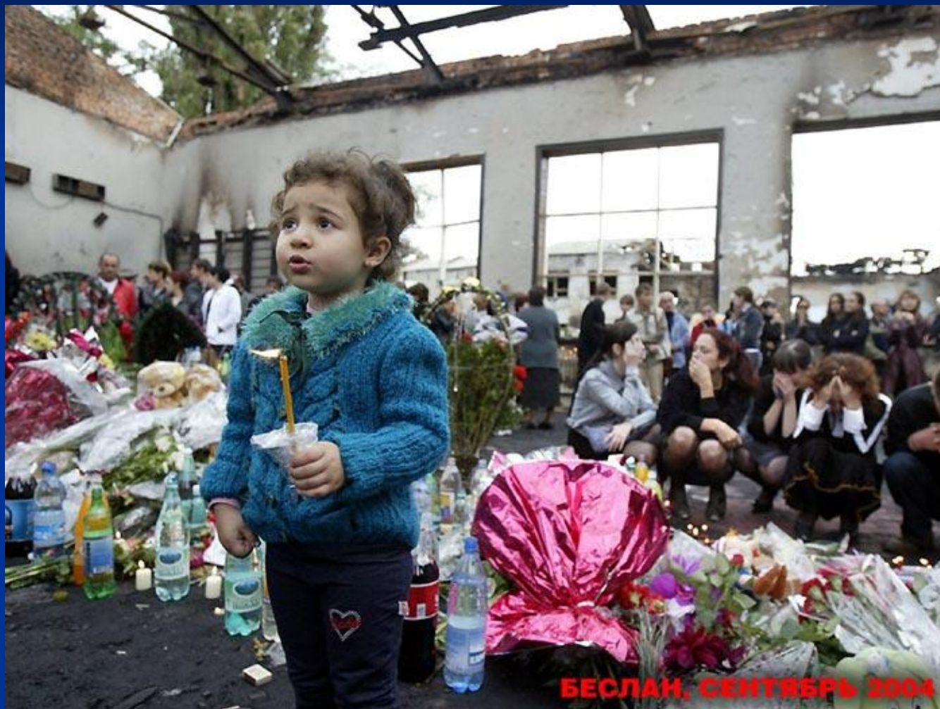
БЕСЛАН, СЕНТЯБРЬ 2004

Террористическая акция рассчитана на то, чтобы посеять страх, создать угрозу многим людям.