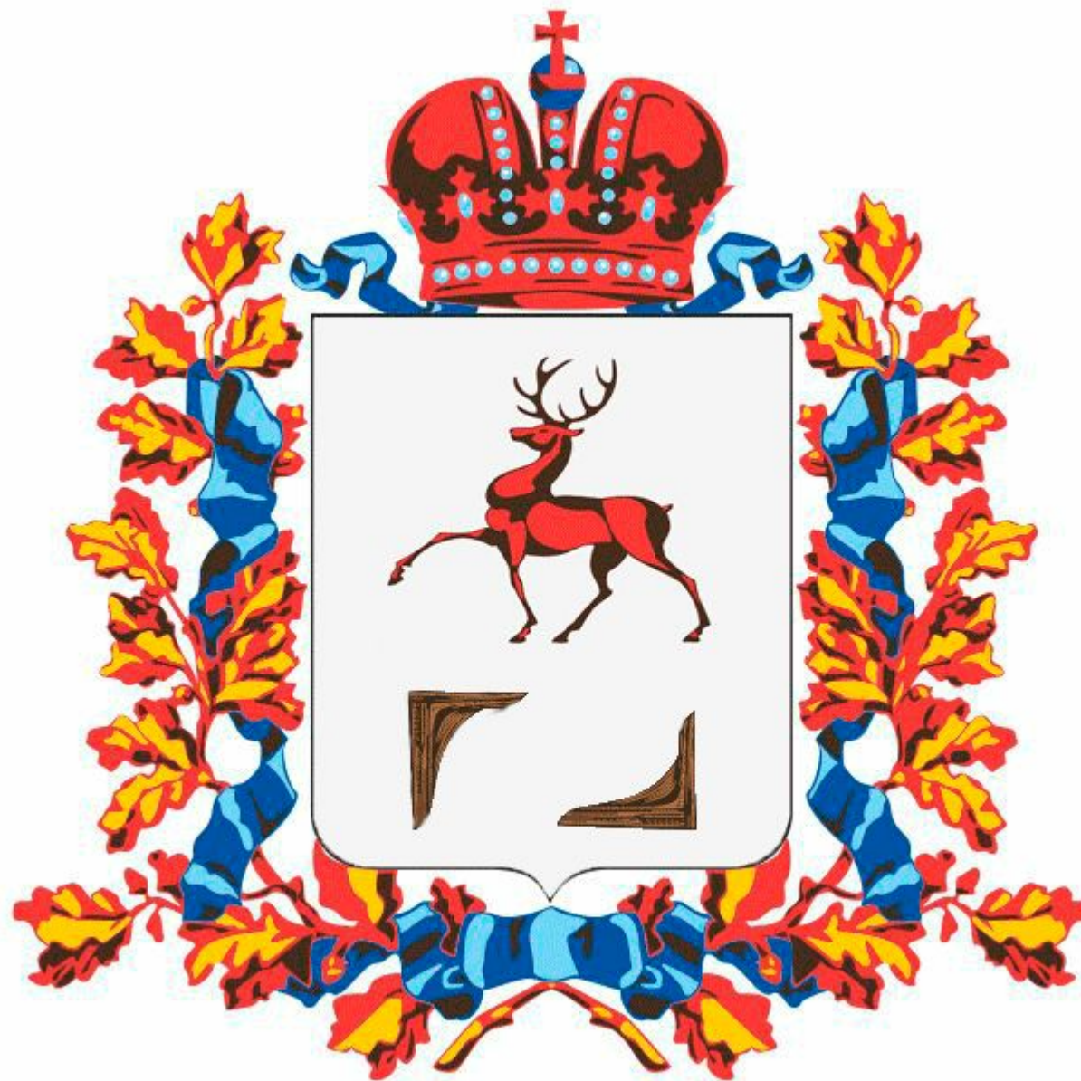
□ Герб Балахны