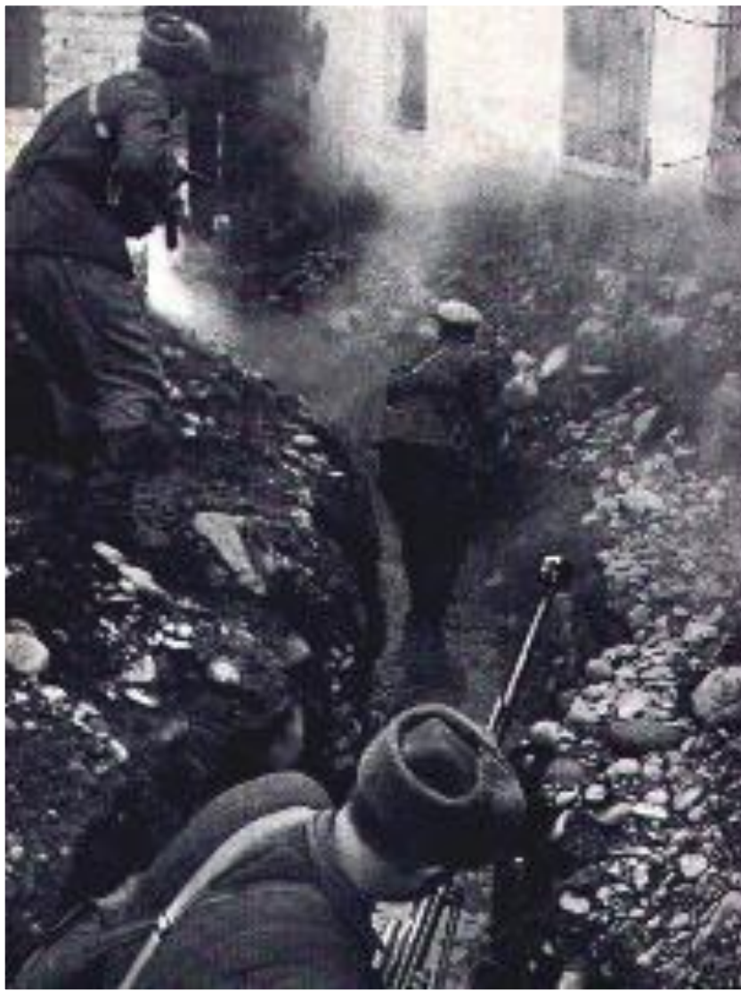
Бой за Моздок. Сентябрь 1942 г.

Начиная войну Гитлер рассчитывал, что СССР развалится как «карточный домик», но советский народ наоборот ТОЛЬКО СПЛОТИЛСЯ.