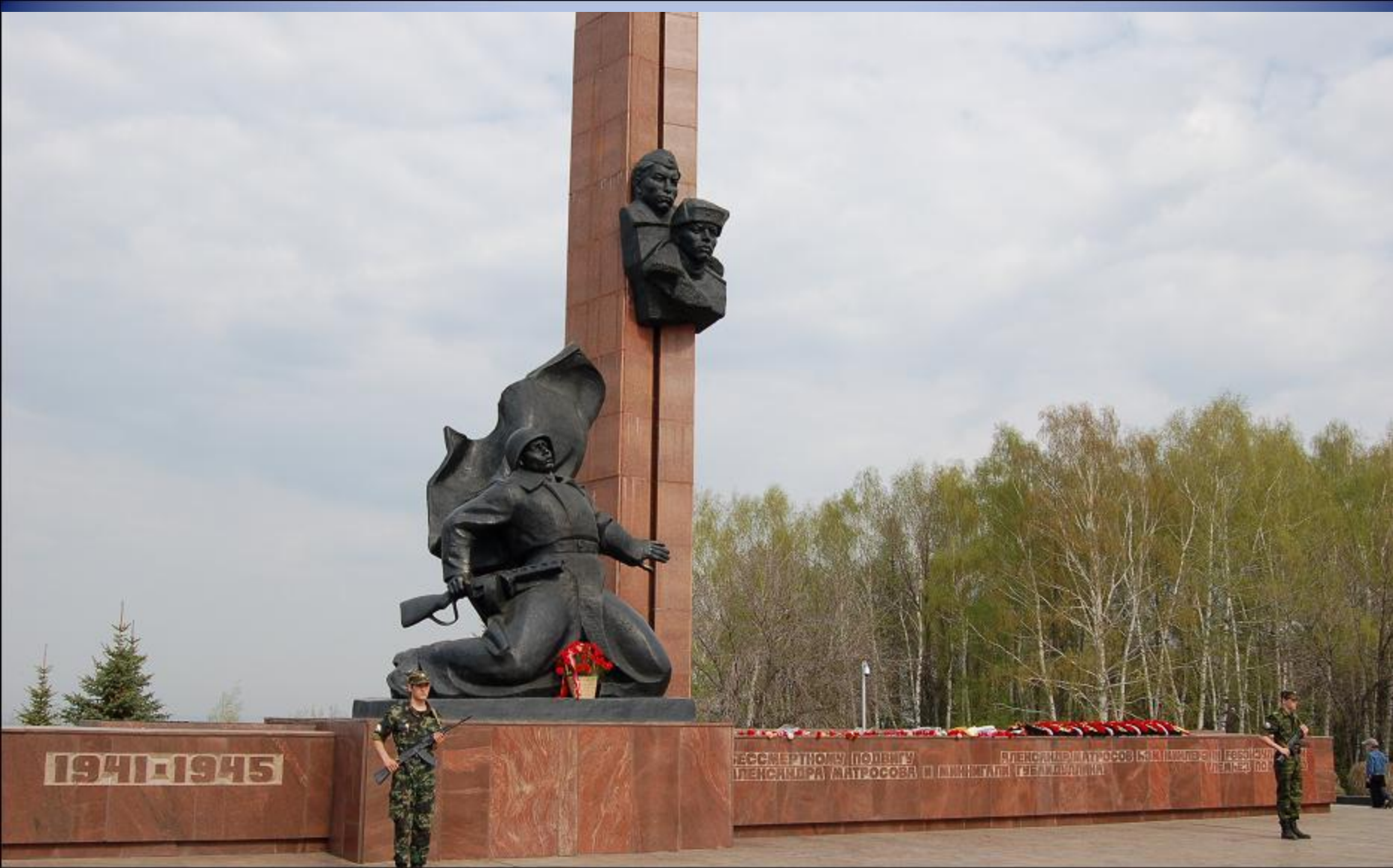
Памятник воинам, погибшим в Великой Отечественной войне, г. Уфа, Республика Башкортостан