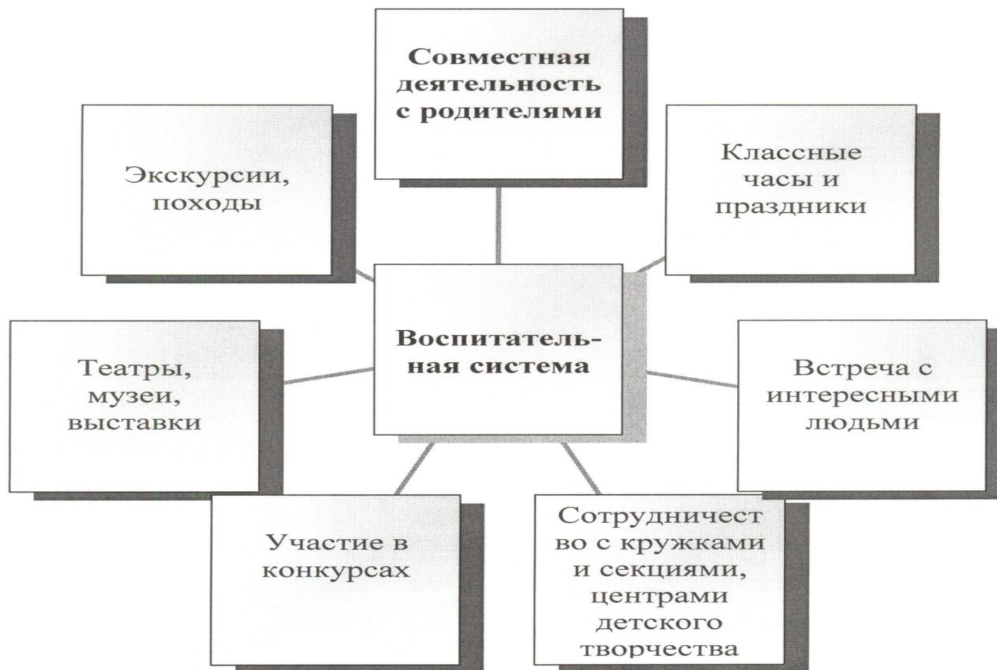
Схема реализации воспитательной работы по формированию культуры здорового и безопасного образа жизни через различные виды и формы деятельности.