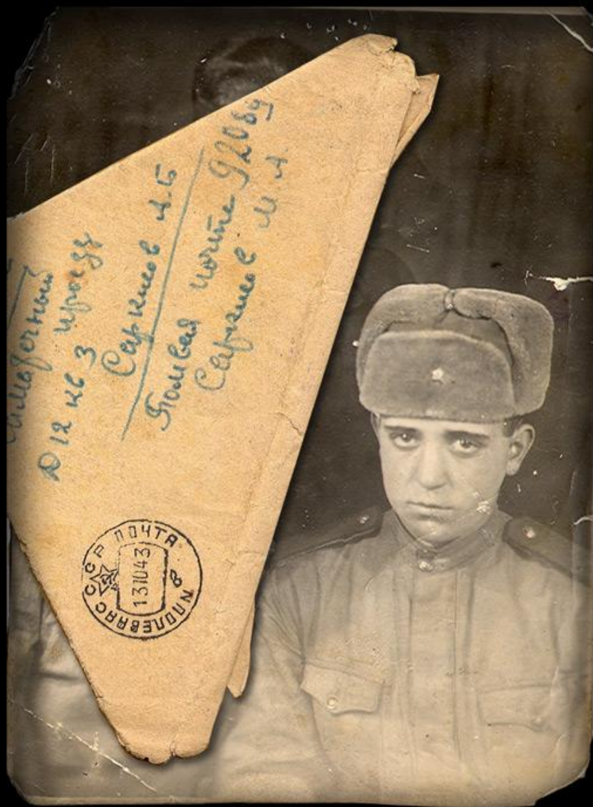
Письмо с фронта