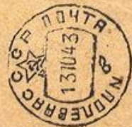
Письмо с фронта