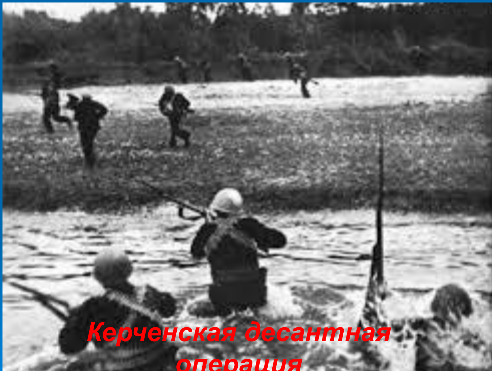
Керченская десантная операция