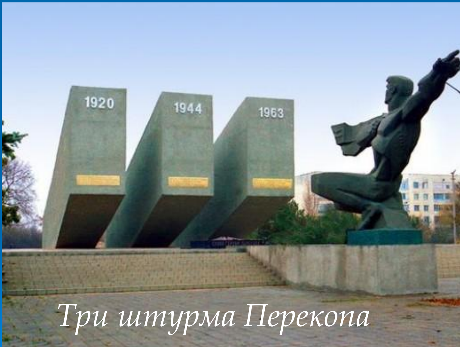
Три штурма Перекোпа