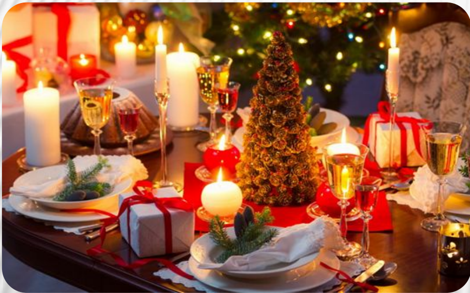
Фото: Традиции и обычаи русского народа. Рождество и Новый год

Обычно на Новый год, 31 декабря, дарят подарки, накрывают на стол, провожают старый год, а далее встречают Новый год под бой курантов и обращение президента России к гражданам. Рождество является православным праздником, который тесно вошел в быт русского народа. Этот светлый день отмечают все граждане страны независимо от наличия у них веры.