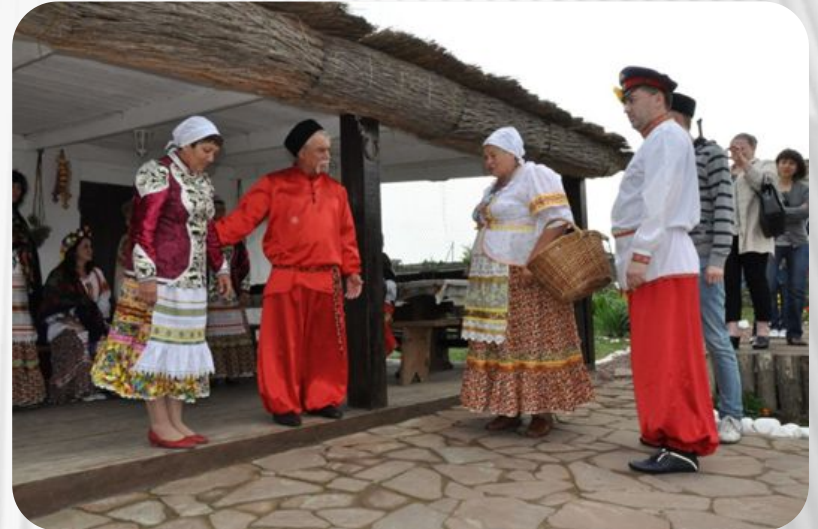
Фото: Традиции и обычаи русского народа. Свадебные обычаи

После того, как молодой человек принял решение о выборе кандидатуры в спутницы жизни, возникает необходимость проведения сватовства. Данный обычай подразумевает нанесение визита женихом с его доверенными лицами (обычно это родители) в дом к невесте. Жениха с сопровождающими его родственниками встречают родители невесты за накрытым столом. Во время застолья принимается совместное решение о том, состоится ли свадьба между молодыми.