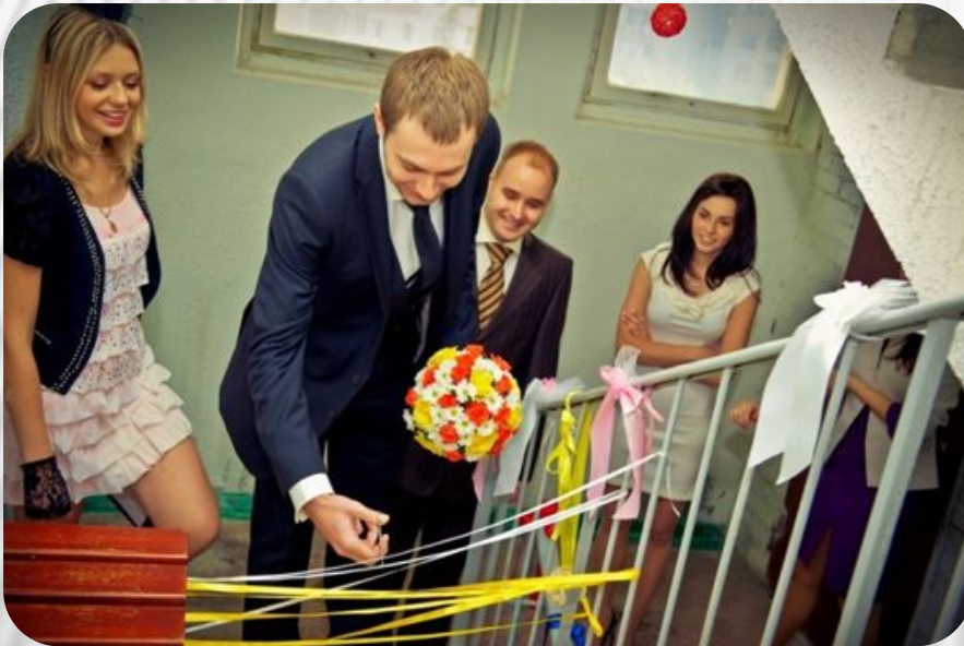
Фото: Традиции и обычаи русского народа. Свадебные обычаи

Самый веселый и непосредственный этап свадебного торжества. Жених вместе со своими родственниками, друзьями приезжает к порогу невесты, где его поджидают все остальные гости. На пороге процессию встречают представительницы невесты – подружки и родственницы.