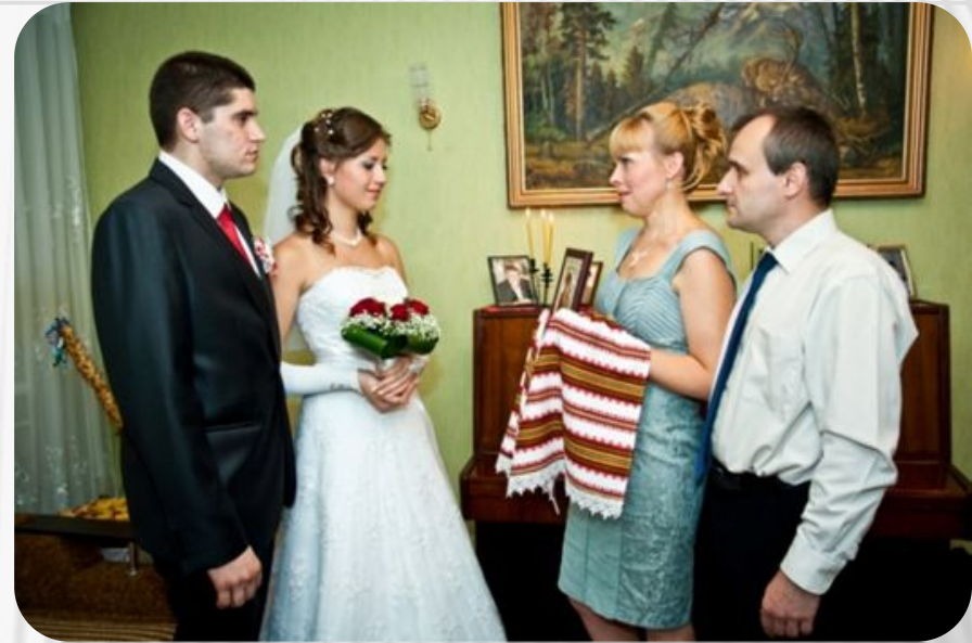
Фото: Традиции и обычаи русского народа. Свадебные обычаи