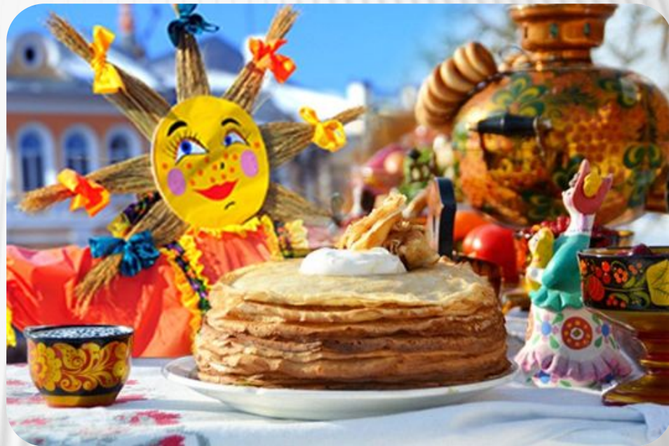
Фото: Традиции и обычаи русского народа. Масленица

В древние времена масленица считалась днем поминовения умерших людей. Поэтому процесс сжигания чучела рассматривался в качестве похорон, а поедание блинов являлось поминками. Со временем русский народ постепенно преобразил восприятие данного праздника. Масленица стала днем проводов зимы и предвкушения наступления весны.