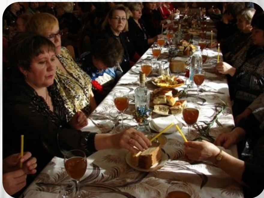
Фото: Традиции и обычаи русского народа. Поминки

Во время обряда все присутствующие за столом вспоминают усопшего добрым словом. Поминки принято проводить непосредственно в день похорон, на девятый день, на сороковой день и спустя год после смерти.