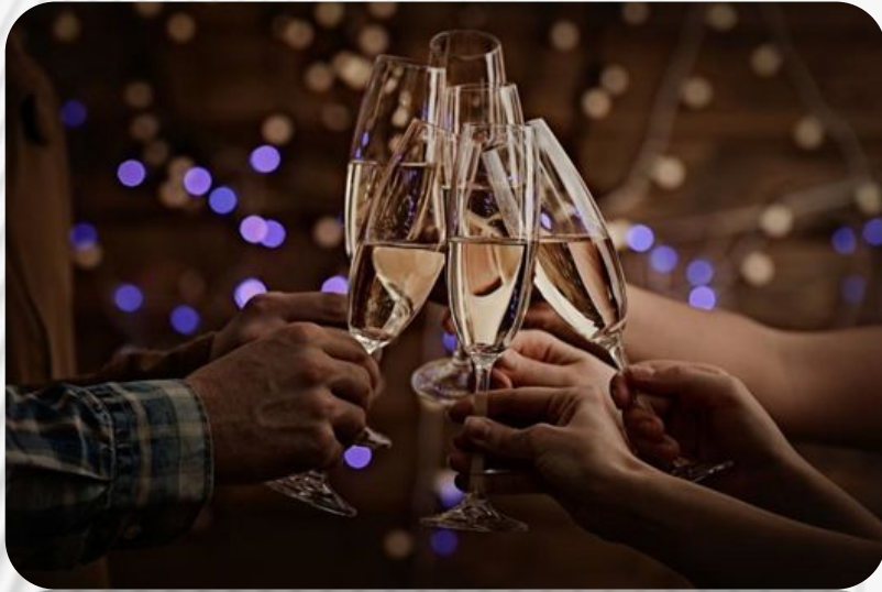
Фото: Традиции и обычаи русского народа. Новый год и Рождество