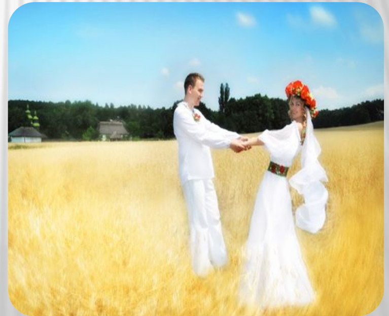
Фото: Традиции и обычаи русского народа. Свадебные обычаи

Особенное место в повседневной жизни занимают свадебные обычаи и традиции русского народа. Свадьба – это день образования новой семьи, наполненный множеством ритуалов и развлечений.