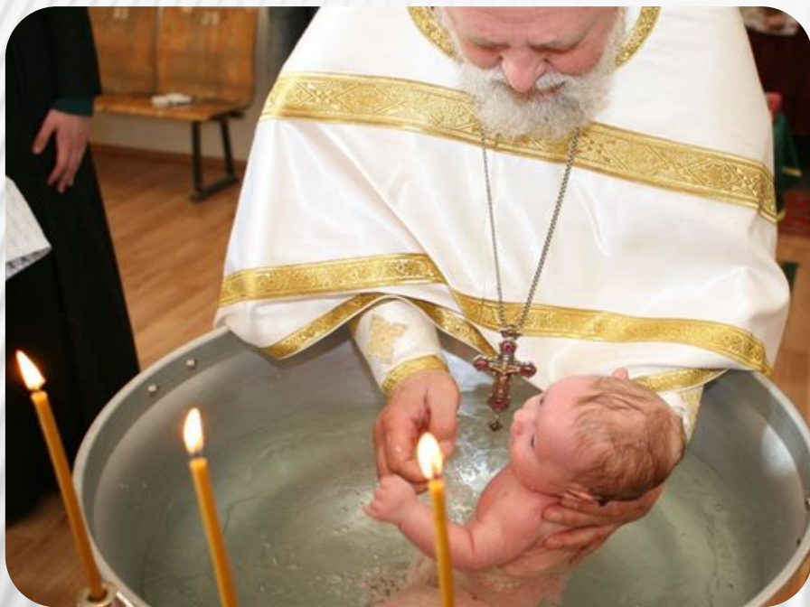
Фото: Традиции и обычаи русского народа. Крестины

Обряд крещения существует на Руси с давних времен. Ребенок должен быть обязательно окроплен святой водой в храме, а на его шею при этом должен быть надет крестик. Данный обряд призван защитить малыша от нечистых сил.