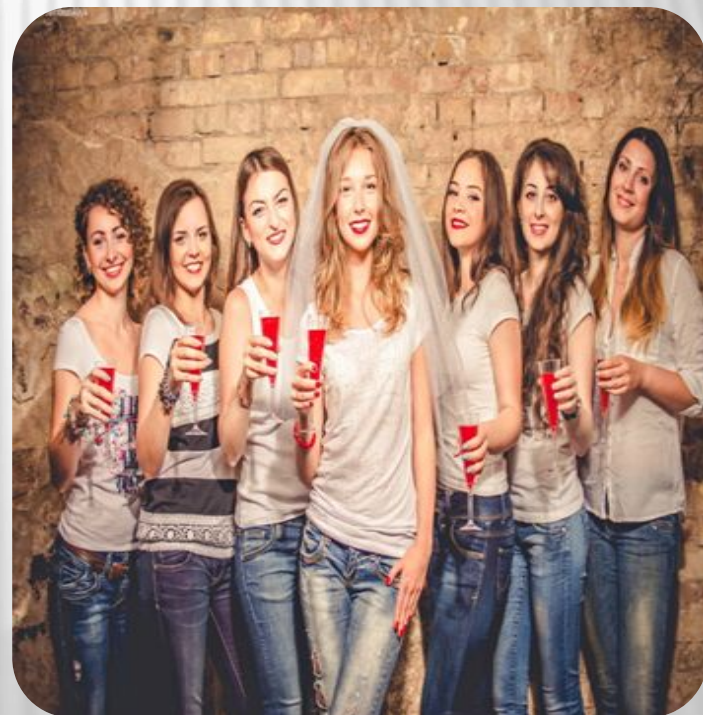
Фото: Традиции и обычаи русского народа. Свадебные обычаи

Ближе ко дню торжества невеста назначает девичник. В этот день она собирается со своими подружками и родственницами, чтобы напоследок повеселиться в качестве свободной девушки, необремененной семейными заботами. Девичник может проходить где угодно – в бане, в доме невесты и т.д.