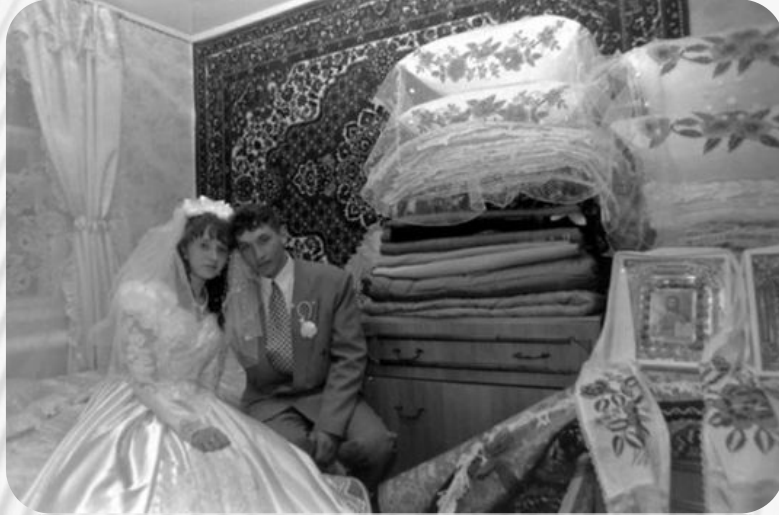
Фото: Традиции и обычаи русского народа. Свадебные обычаи

После принятия положительного решения относительно бракосочетания молодых, возникает вопрос подготовки приданого невесты. Обычно приданое готовит мать девушки. Оно включает в себя постельное белье, посуду, предметы обстановки, одежду и т.д. Особенно богатые невесты могут получить от родителей машину, квартиру или дом.