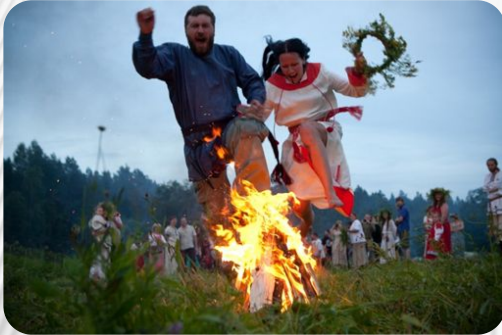
Фото: Традиции и обычаи русского народа. Купала

Данный обряд стал традиционным ежегодным празднованием летнего солнцестояния. Он смешивает в себе одновременно языческие и христианские традиции.