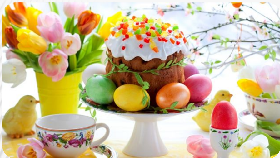
Фото: Традиции и обычаи русского народа. Пасха

Праздник Пасхи на Руси считается светлым днем всеобщего равенства, прощения и доброты. В этот день принято готовить стандартные для этого праздника угощения.