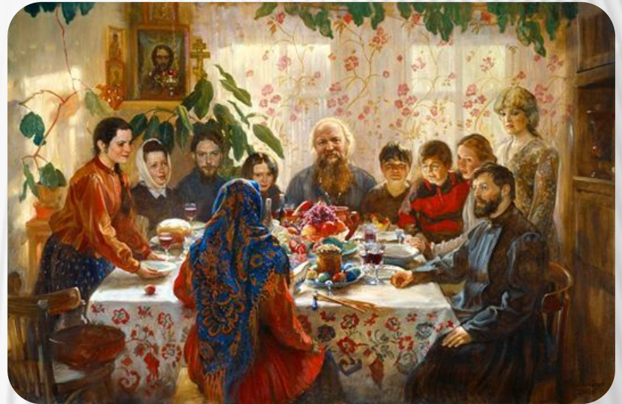
Фото: Традиции и обычаи русского народа. Застолье

Еще с давних времен любой уважаемый человек считал своим долгом периодически устраивать пиршества и приглашать на них большое количество гостей. Такие события планировались заранее и готовились к ним с большим размахом.