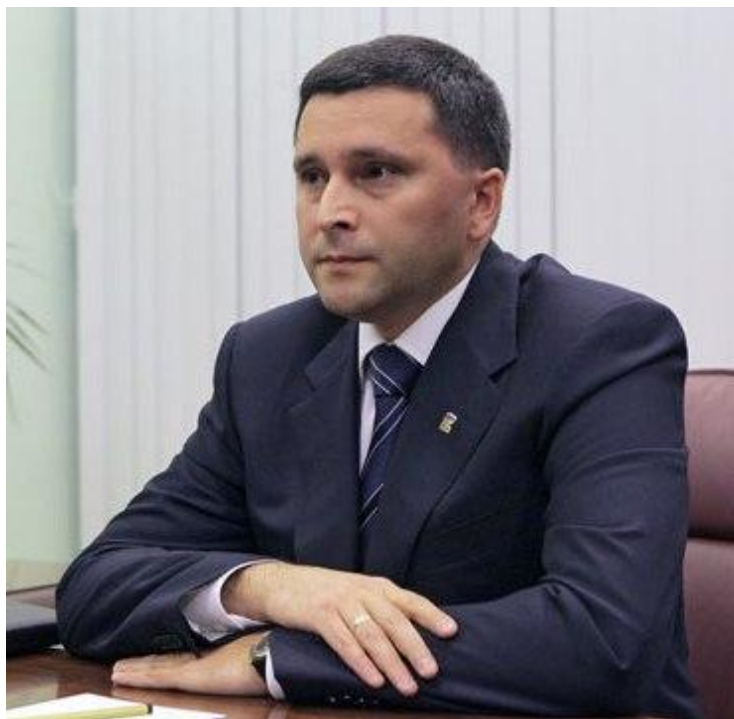
Кобылкин Дмитрий Николаевич