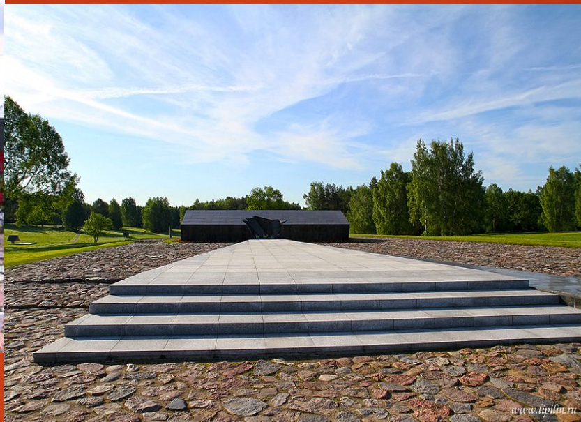
Символическая крыша сарая