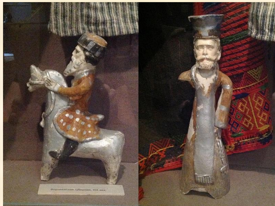
Вознесенская губерния, XIX век.

В начале XX века на рынке продавалось очень много глиняных игрушек. Они раскрашивались красными, желтыми, лиловыми, синими, золотыми и серебряными красками. Особенности местных игрушек были наклепленные рога оленя, плетеные рога, пышные гривы. В наше время продолжают развивать и возрождать игрушечное дело Народные мастера изготовления глиняной игрушки.