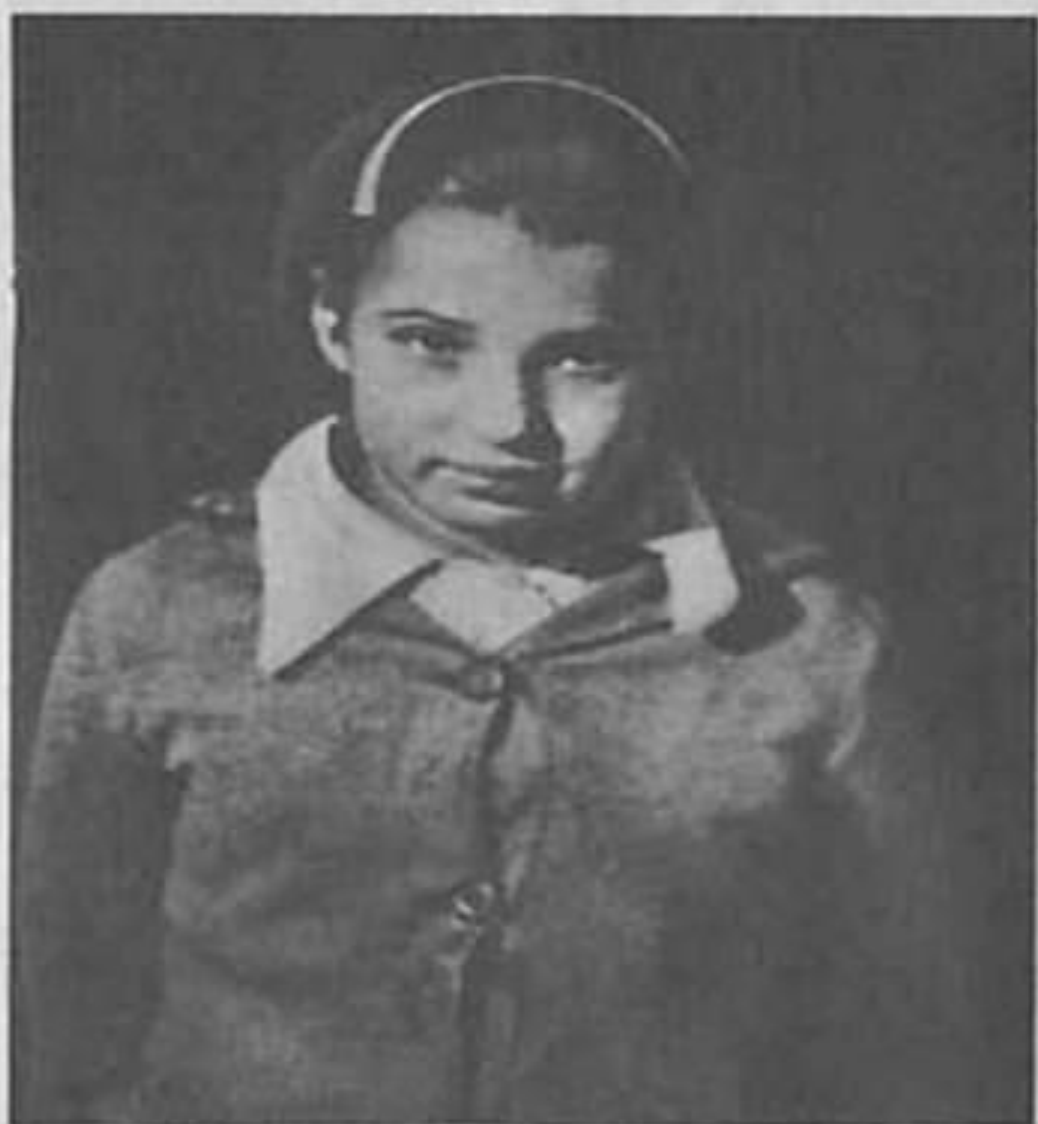
Таня Савичева. Фрагмент группового снимка