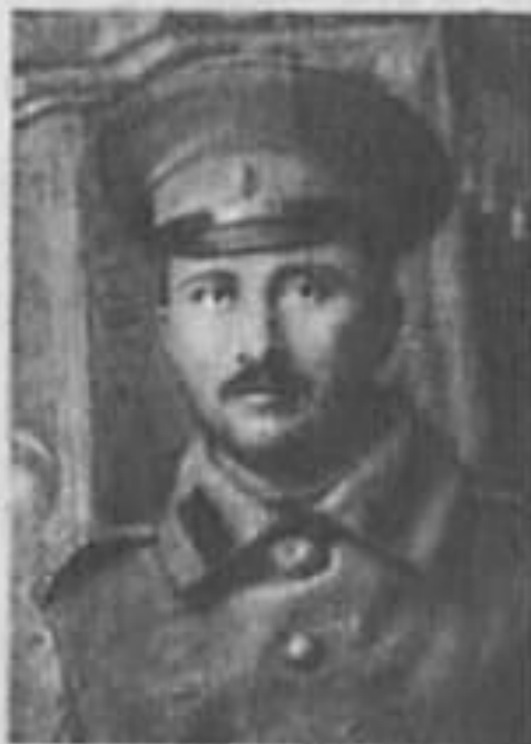
Василий Родионович Савичев (1885—1942). Фото 1915 г.