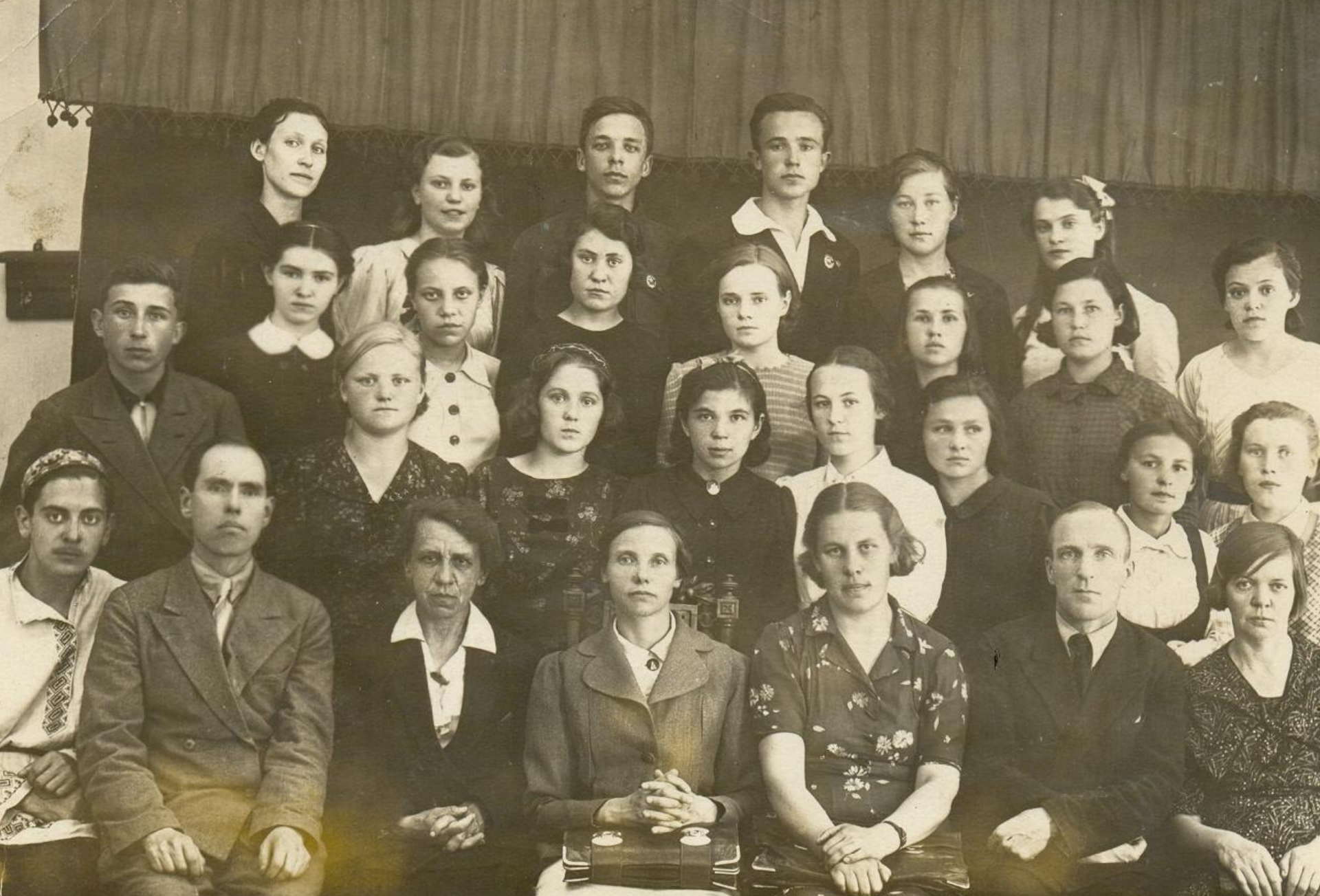
Выпуск 1941 года