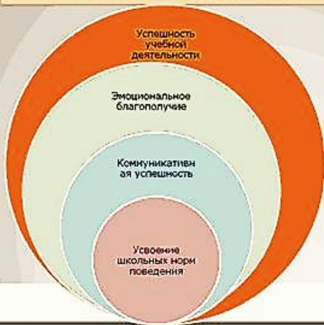
Схема социально-психологической адаптации школьника