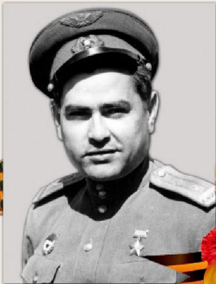
МАРЕСЬЕВ АЛЕКСЕЙ ПЕТРОВИЧ (1916г. - 2001г.)