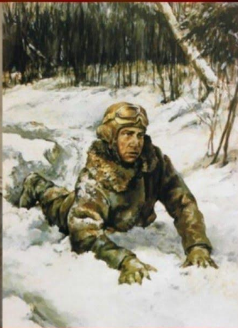
Лётчик-истребитель Алексей Маресьев