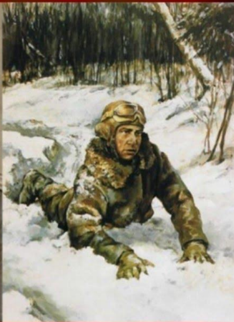
Лётчик-истребитель Алексей Маресьев