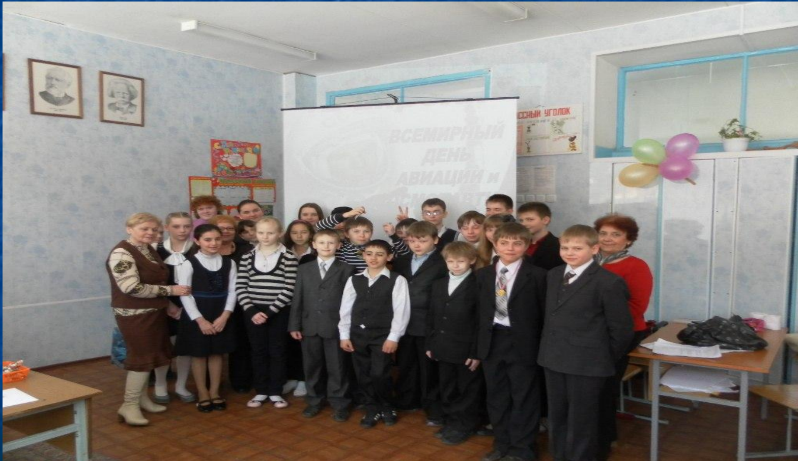
Мероприятие, посвященное Дню Авиации и Космонавтики, 5 класс