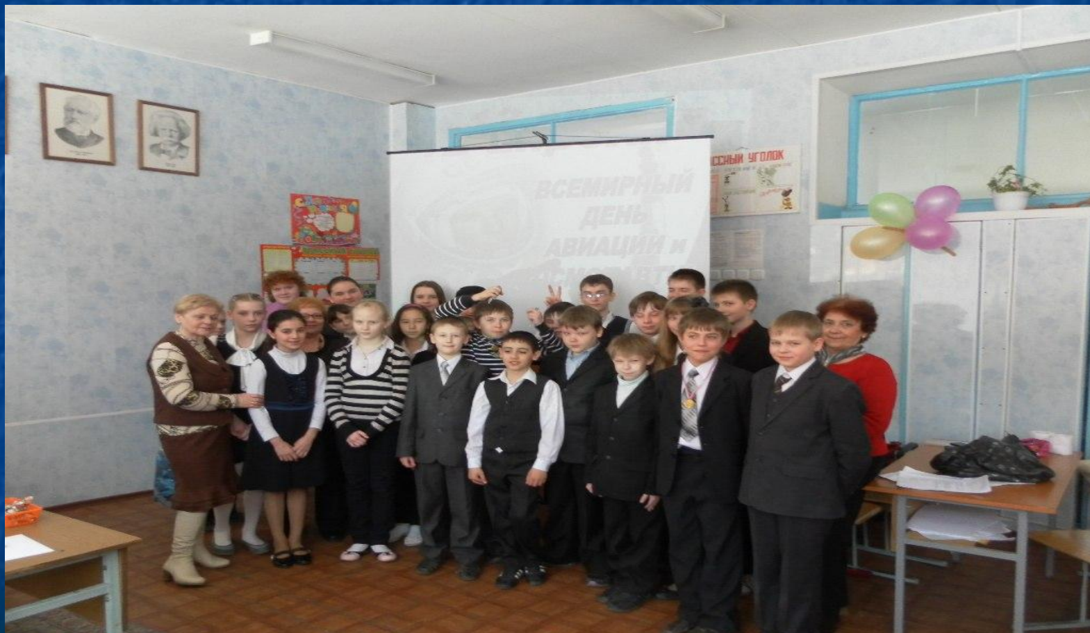
Мероприятие, посвященное Дню Авиации и Космонавтики, 5 класс