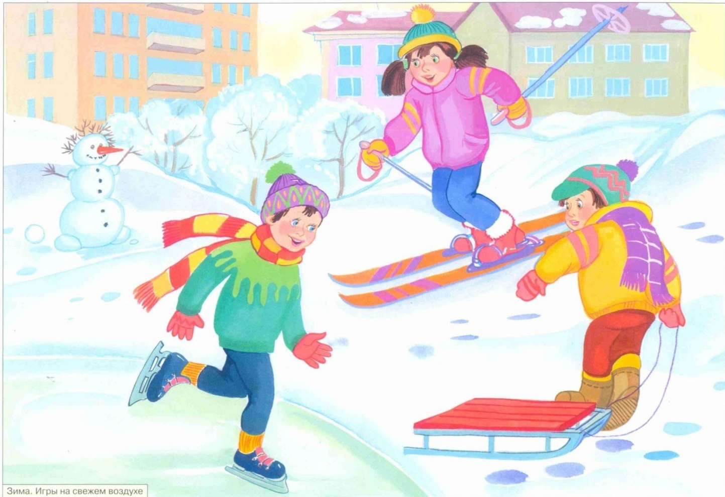
Зима. Игры на свежем воздухе