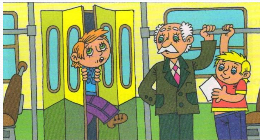
Не прислоняйся к дверям