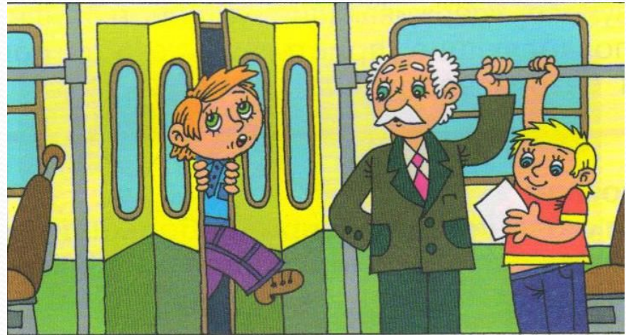
Не прислоняйся к дверям