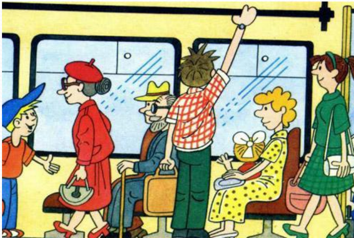
Уступи место старшим