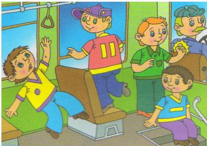
Держись за поручни