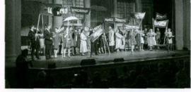
► Парла театро