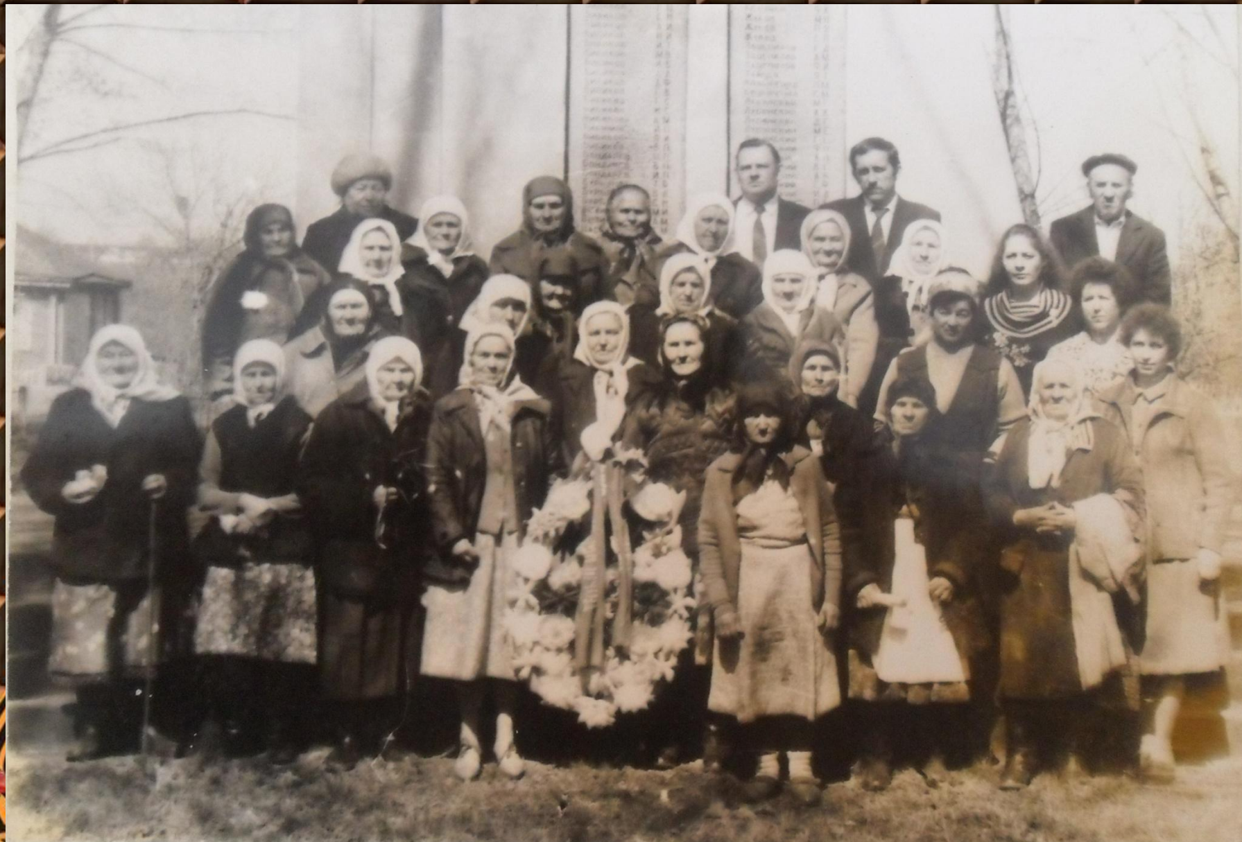
Солдатские вдовы у обелиска павшим воинам (1990 г.)