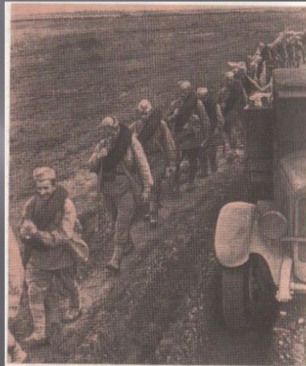
Фронтная дорога.