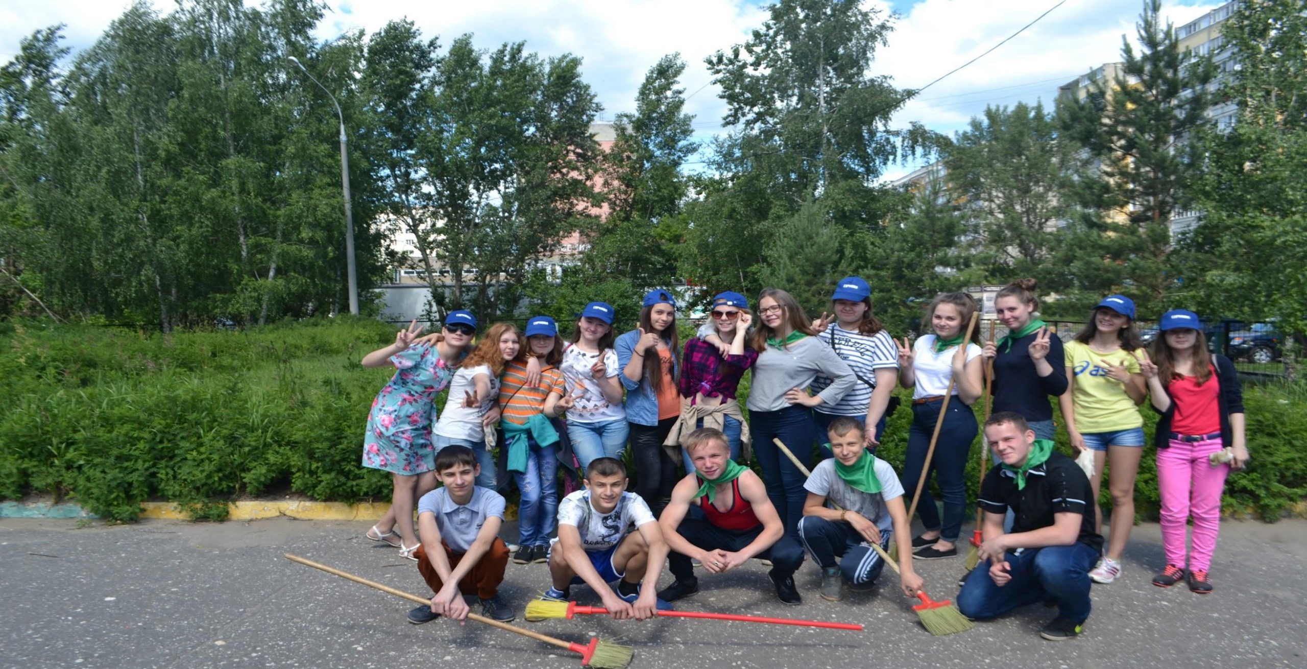
МАОУ «Школа №79 им. Н.А. Зайцева»