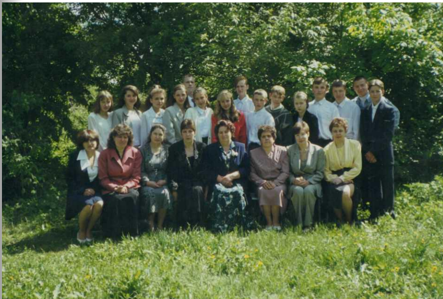
Выпускной вечер в 9 классе