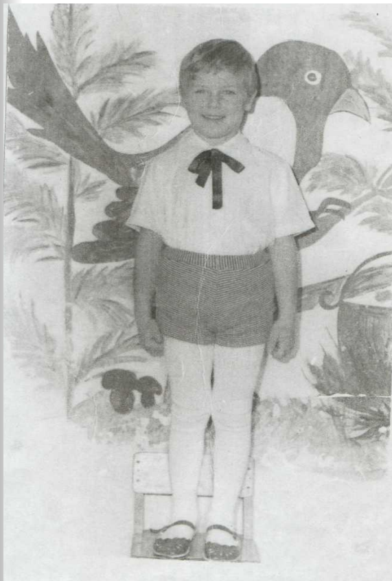
В детском саду