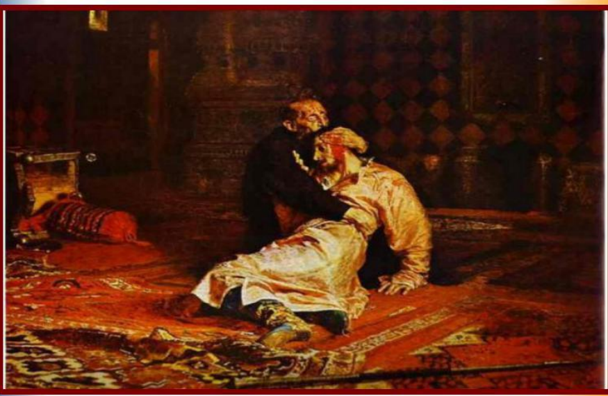
«Иван Грозный убивает своего сына»