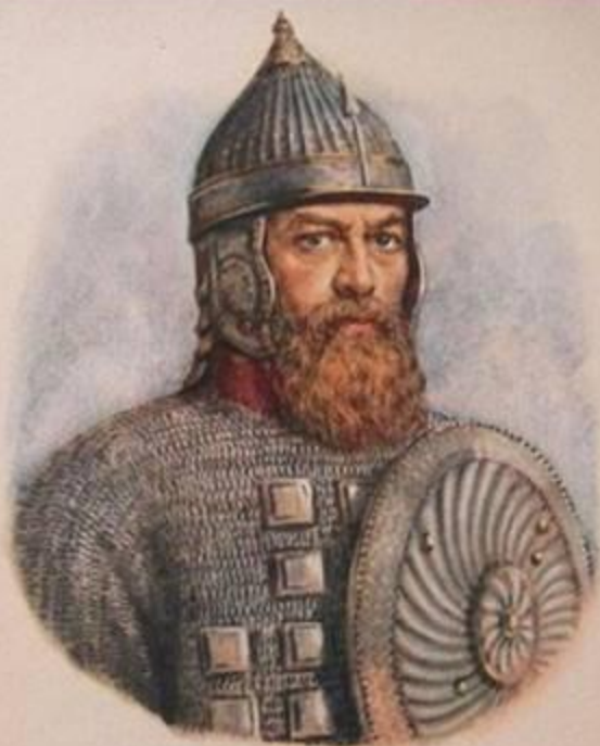
Дмитрий Пожарский 1578 – 1642