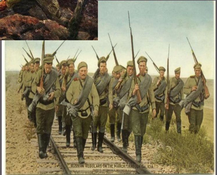
RUSSTAN REGULARS ON THE MARCH THROUGH GALICIA