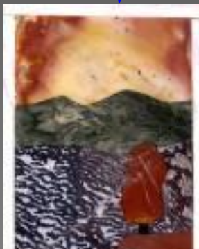
камни, полезные ископаемые