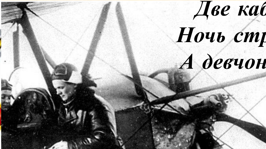
я Бершанская уточ