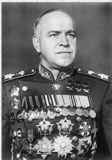
Маршал Жуков Георгий Константинович