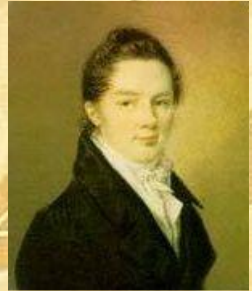
Иван Иванович Пуцин

Пушкин сохранил лицейскую дружбу и культ Лицея на всю жизнь.