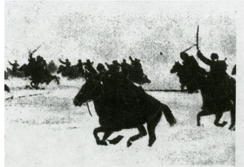
Действующая армия. Конники 3-й Гвардейской кавалерийской дивизии идут в атаку.