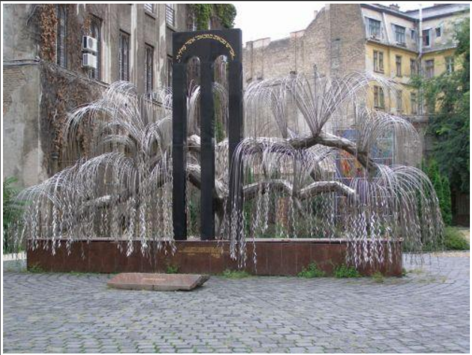
Памятник жертвам холокоста в Венгрии.