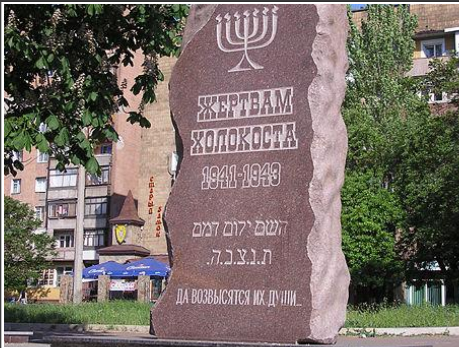
Памятник жертвам холокоста в Донецке