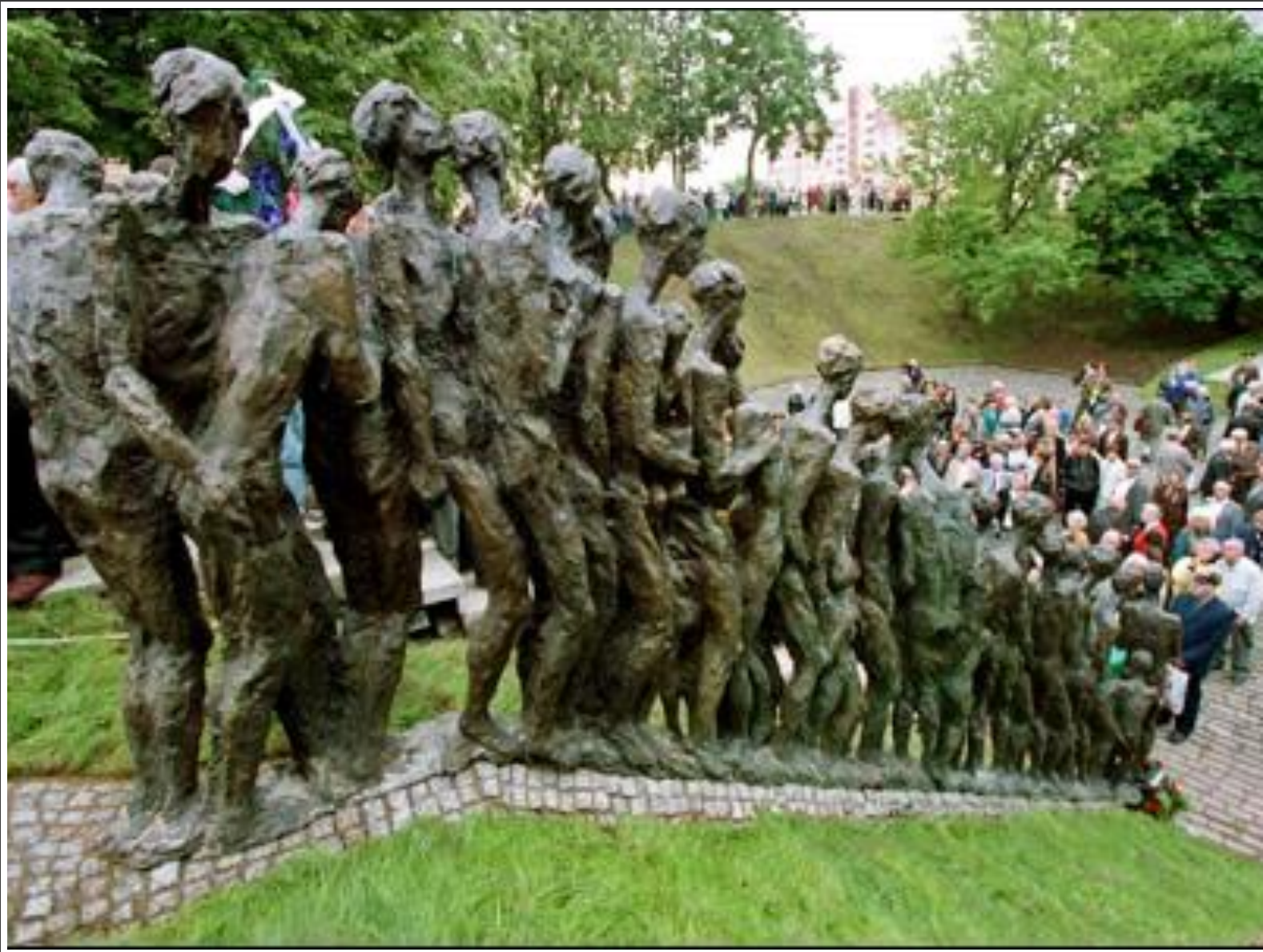
Памятник жертвам холокоста в Минске