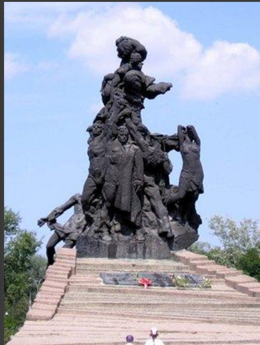
Мемориалы в Бабьем Яру.