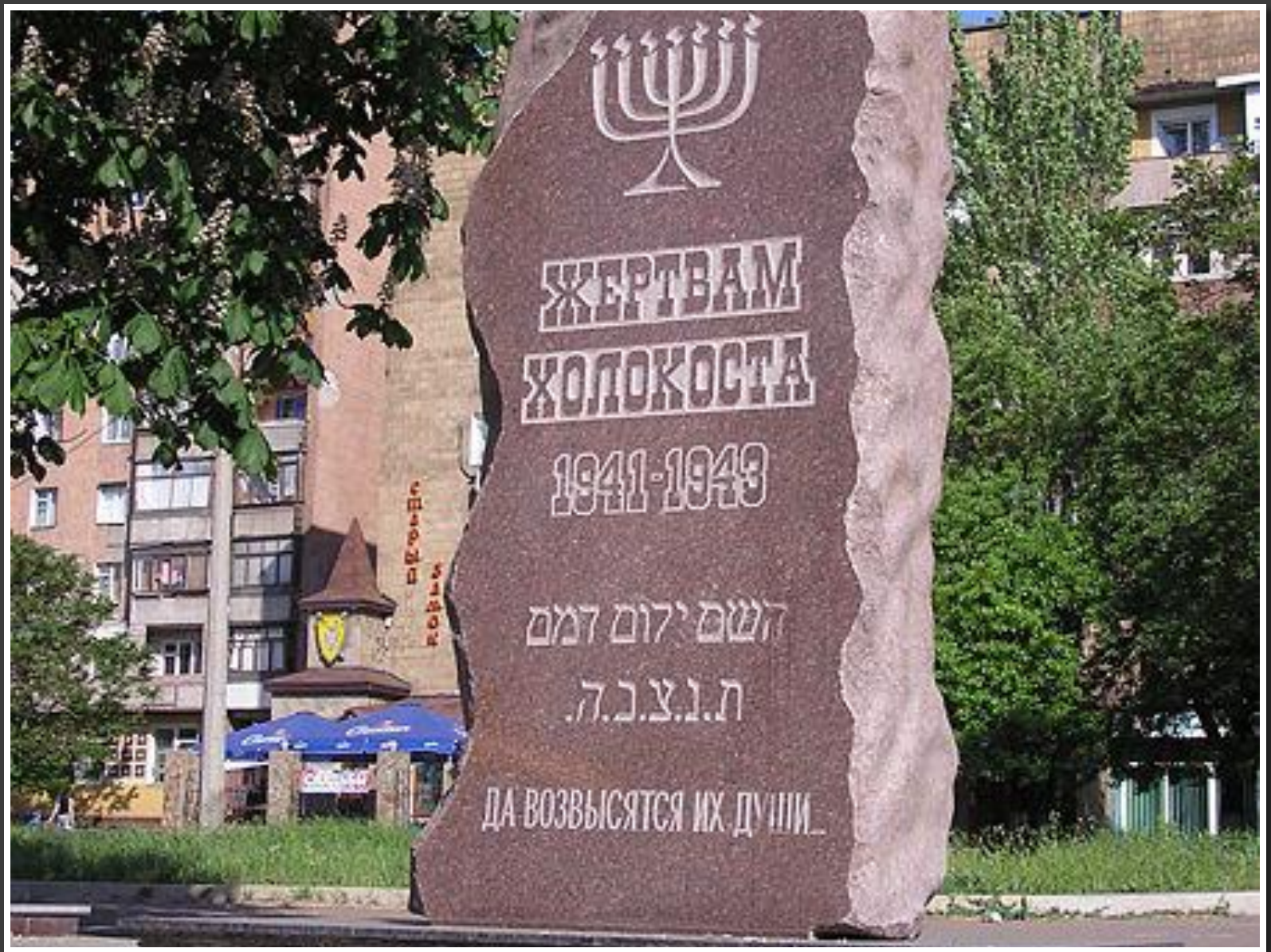
Памятник жертвам холокоста в Донецке