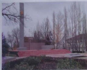
Мемориал Героев Великой Отечественной войны 1941-45 годов

Расположен в центре города на площади Воин. Установлен на месте братской могилы. В могиле похоронены советские воины, умершие от ран в 13 армейских госпиталях, расположенных в 1941 - 1943 гг. в Бутурлиновке. Здесь же погибли погибшие при бомбежке железнодорожной станции рывенце из санитарного эшелона. Братская могила вошла в состав открытого 9 мая 1975 г. мемориального комплекса памяти местных жителей, погибших в годы Великой Отечественной войны.