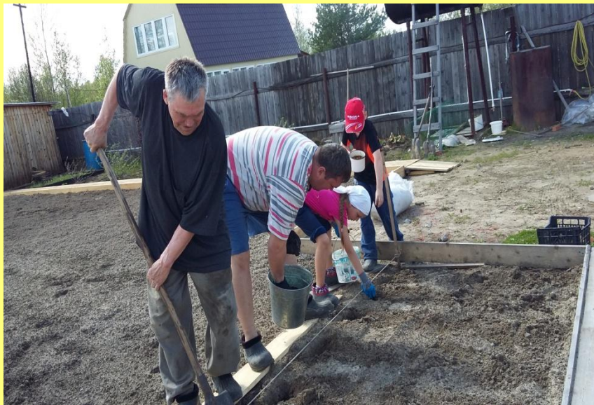
Фото май 2017г.

Наша любимая дача или как мы её называем - усадьба «Илюшкино». Мы очень любим трудиться и отдыхать на нашей даче.