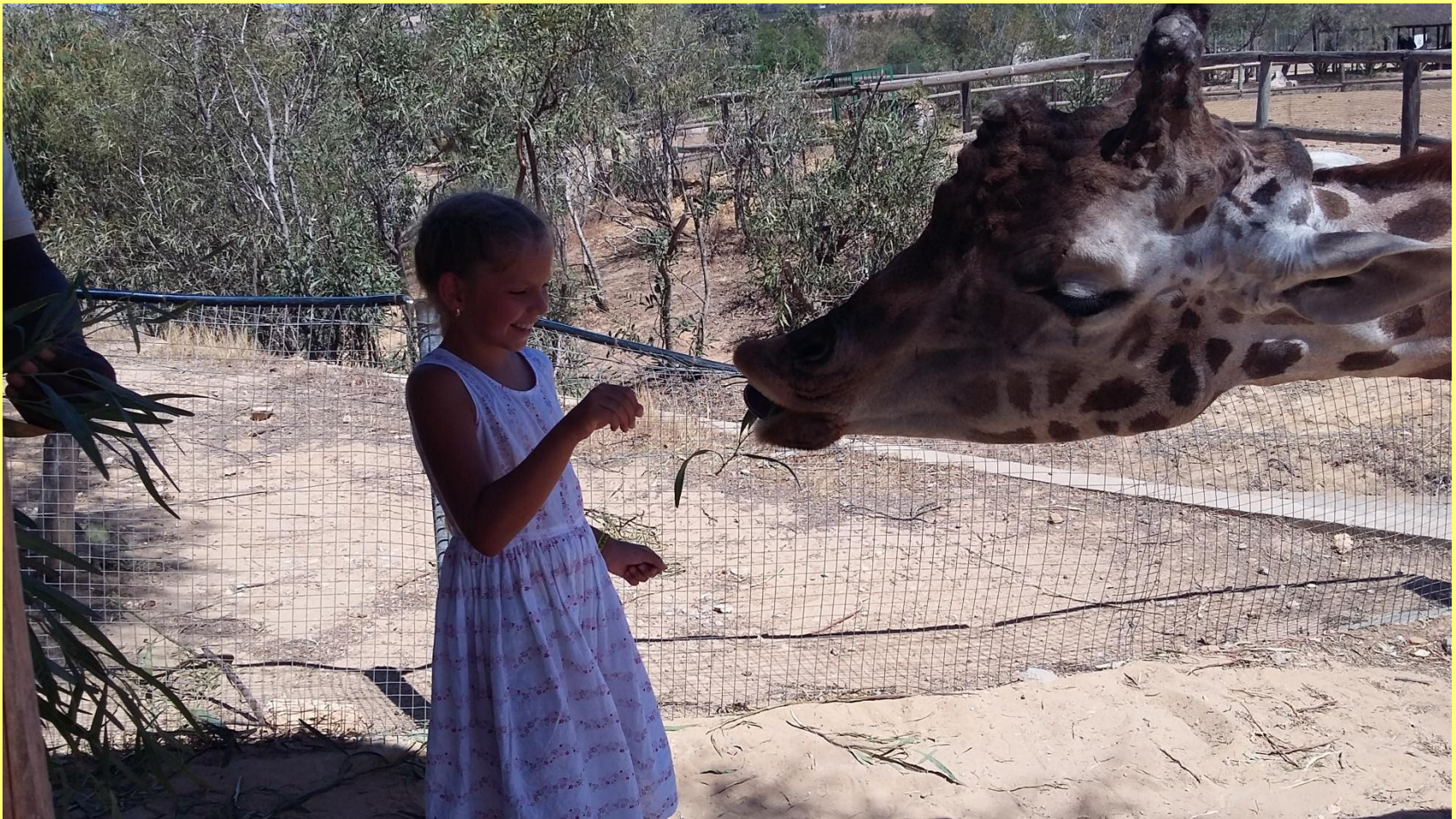
Фото июль 2016г. Тунис. Зоопарк «Фригия»- самый большой в Африке.

Путешествия – это искренняя радость и близость с самим собой и родными, которые рядом.