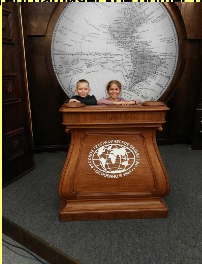
Фото 2017г. Русское географическое общество.

Каждый отпуск стараемся проводить вместе.