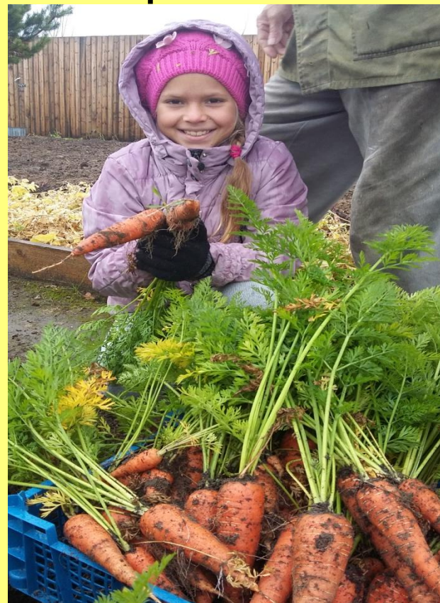
Фото сентябрь 2016г.