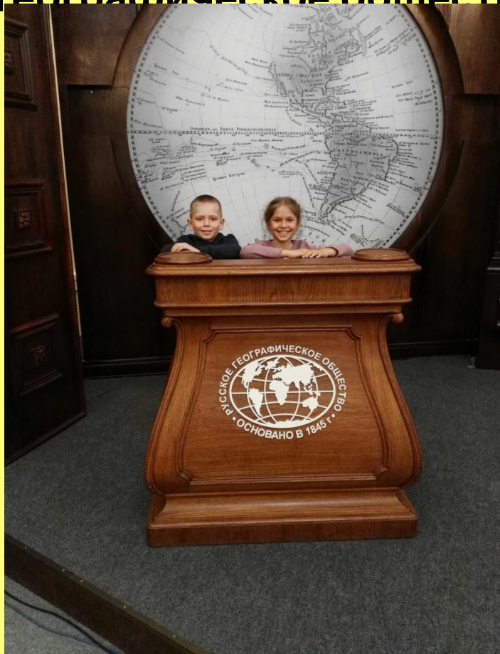
Фото 2017г. Русское географическое общество.

Каждый отпуск стараемся проводить вместе.