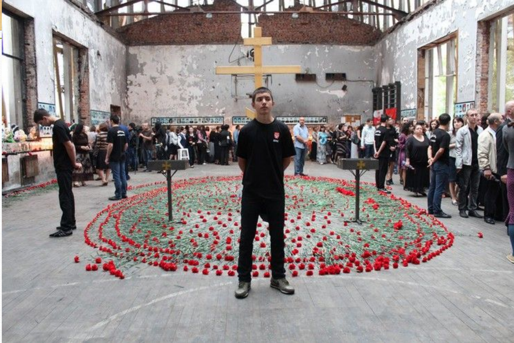
Спортзал школы № 1 г. Беслана