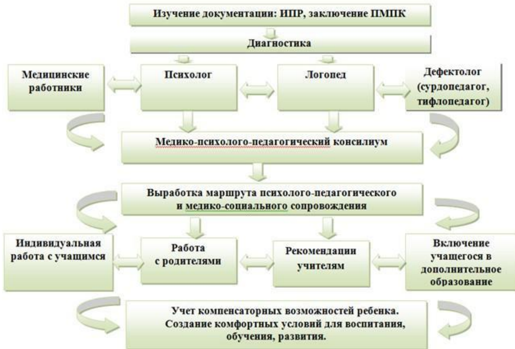
Рисунок 1. Структура комплексного сопровождения обучающегося