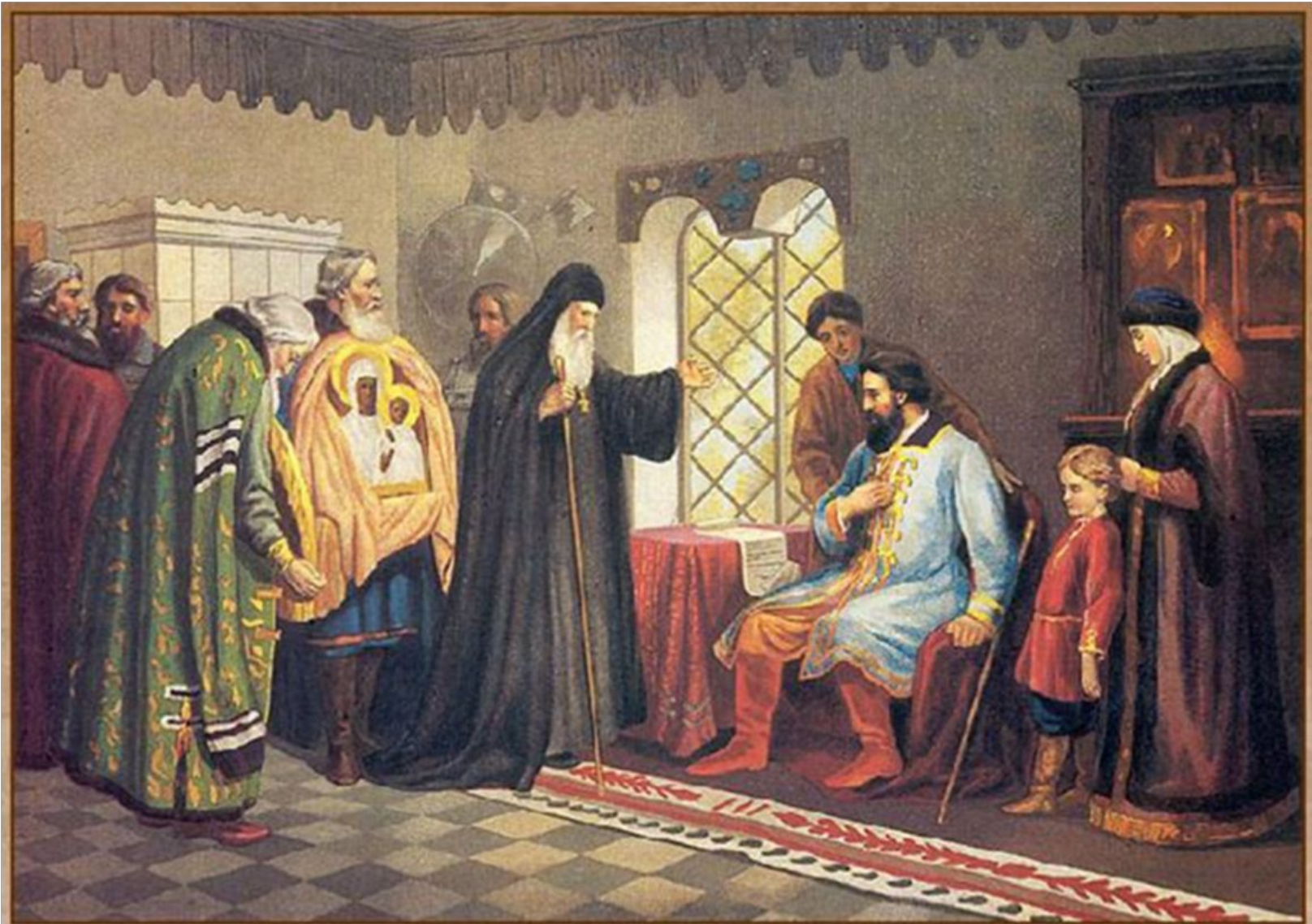
Нижегородские послы у князя Дмитрия Пожарского. 1611 г.

Главным воеводой по совету Кузьмы Минина был приглашен князь Дмитрий Пожарский.