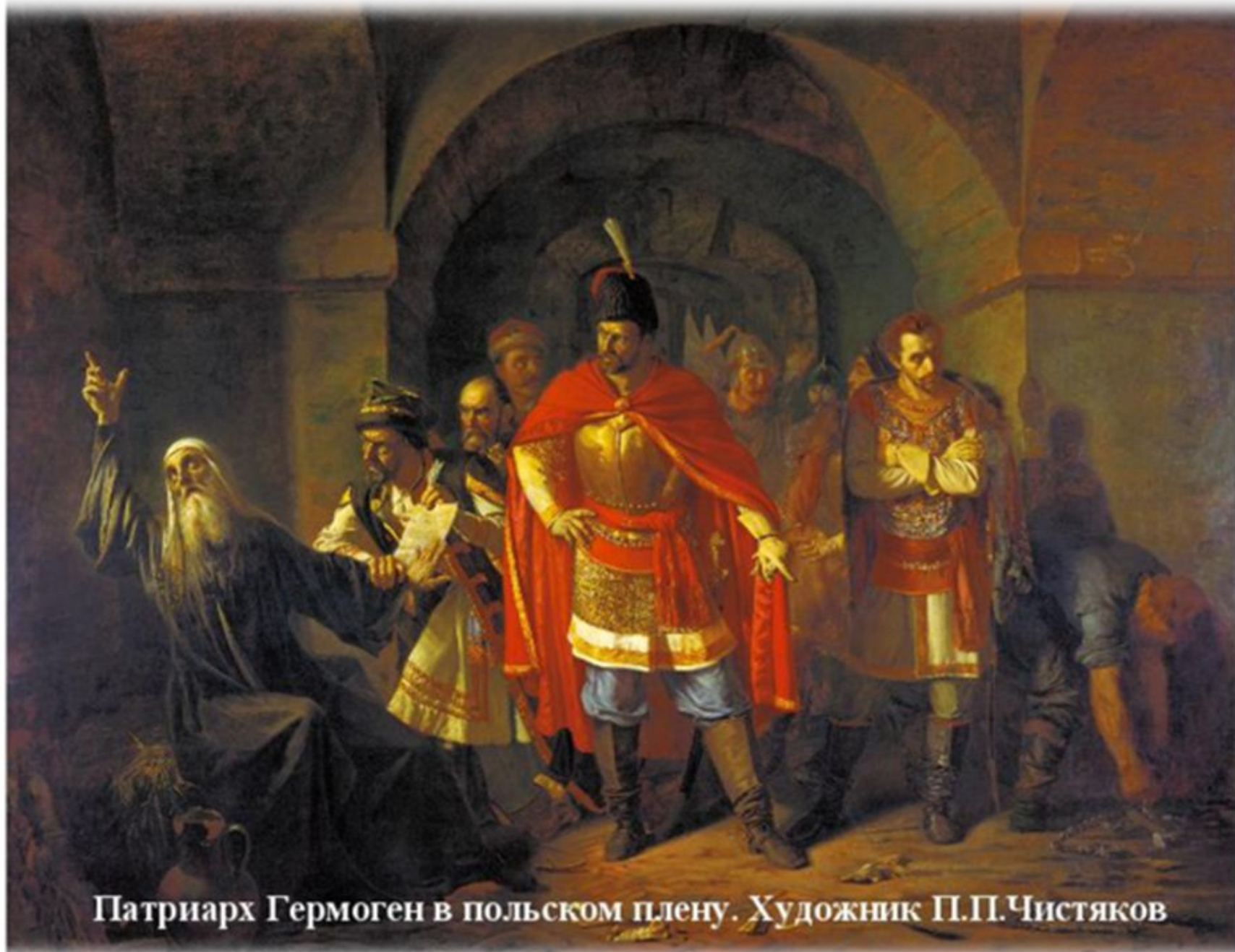
Патриарх Гермоген в польском плену. Художник П.П.Чистяков