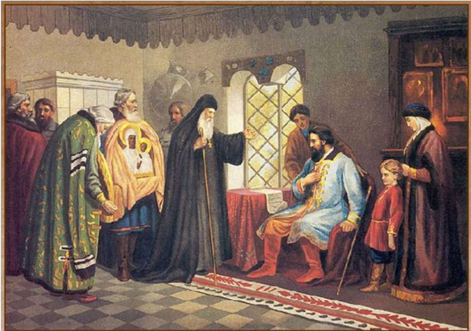
Нижегородские послы у князя Дмитрия Пожарского. 1611 г.

Главным воеводой по совету Кузьмы Минина был приглашен князь Дмитрий Пожарский.