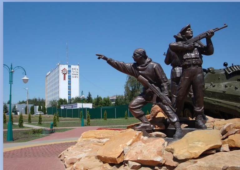
Памятник участникам военных конфликтов и локальных войн. г. Орел