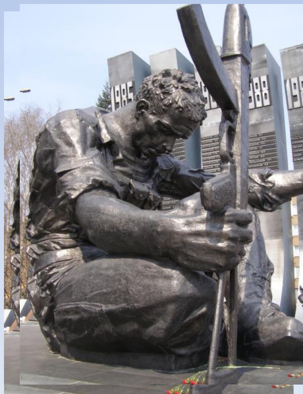
Мемориал в Екатеринбурге