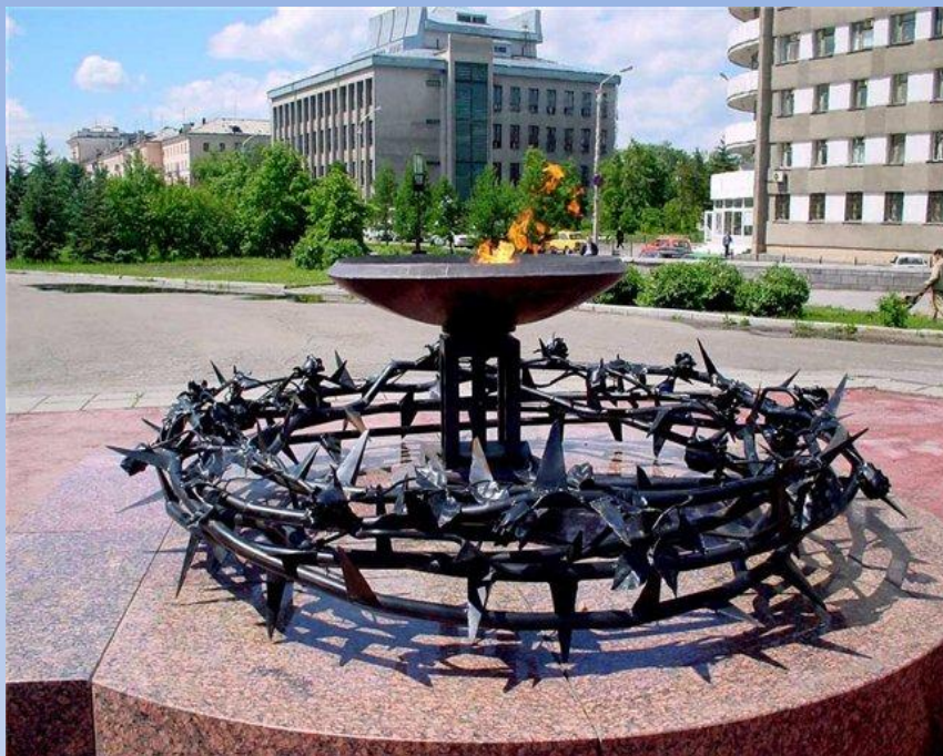
Мемориал памяти воинов, погибших в Афганистане. БАРНАУЛ