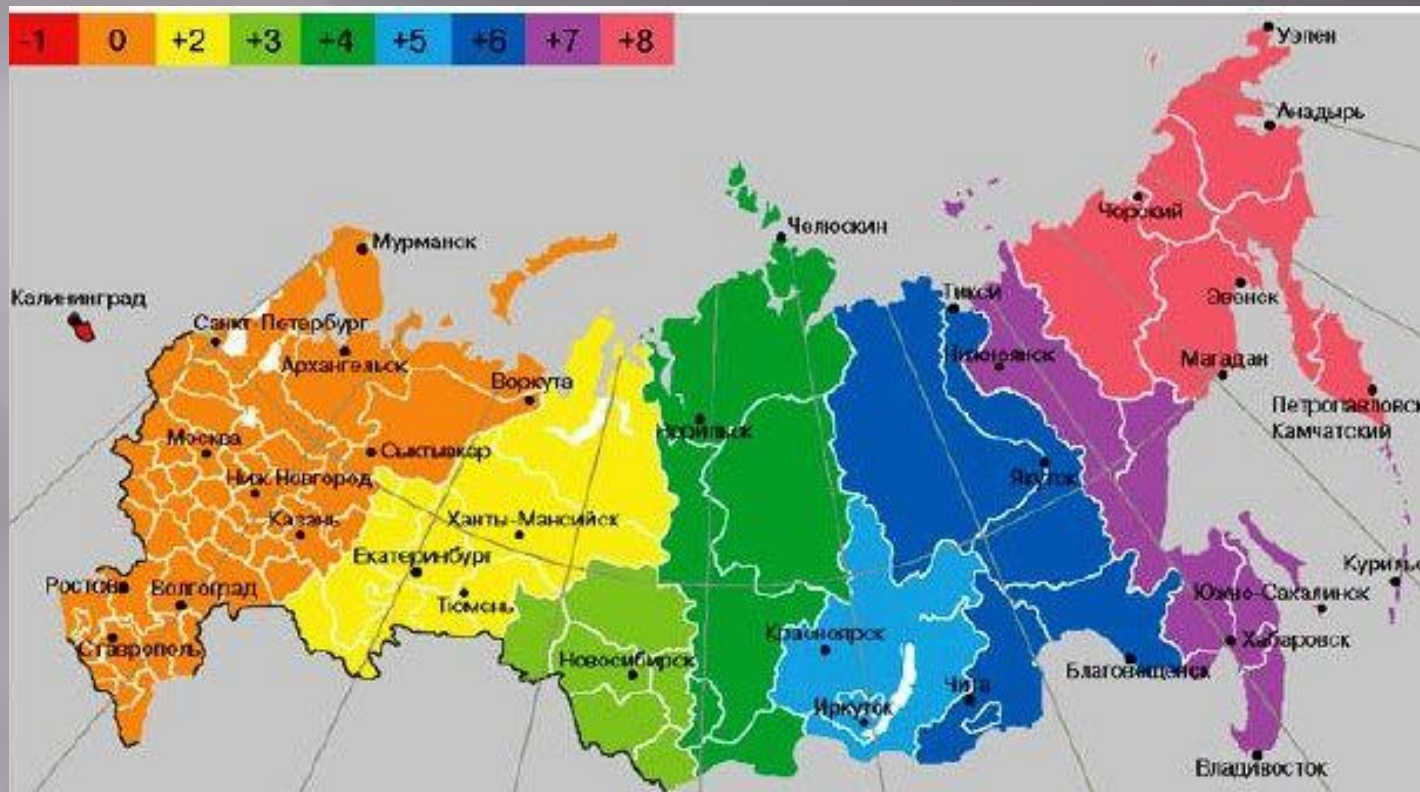
Новые часовые пояса. Цветом показана разница с московским временем