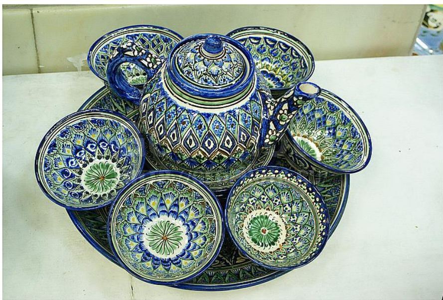
# trn210100194 Middle Asia