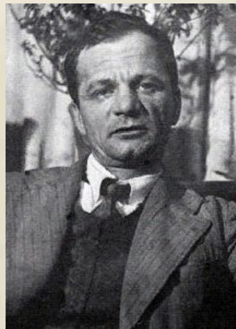
Андрей Платонович Платонов