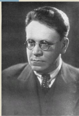
Самуил Яковлевич Маршак