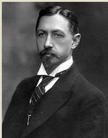
Иван Алексеевич Бунин