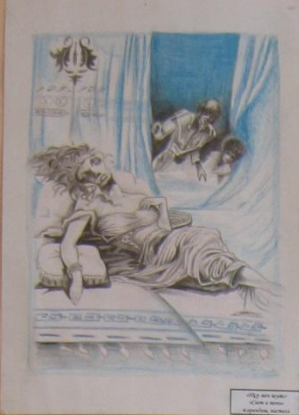
Айраулы Айраулы Айраулы