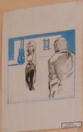
С. Савицкий Женщина и мужчина