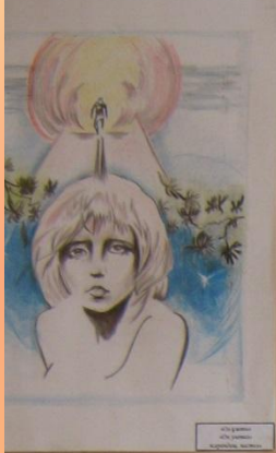
Айраулы Айраулы Айраулы