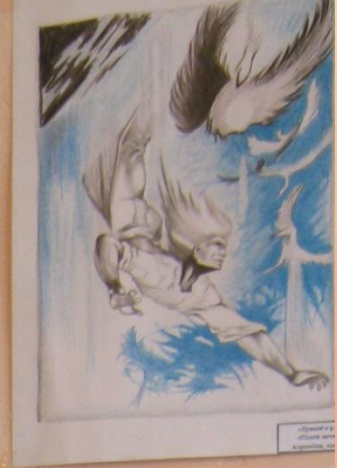
А. Савицкий Женщина с цветами