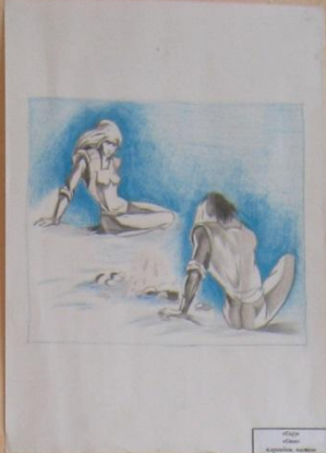
Айраулы Айраулы Айраулы