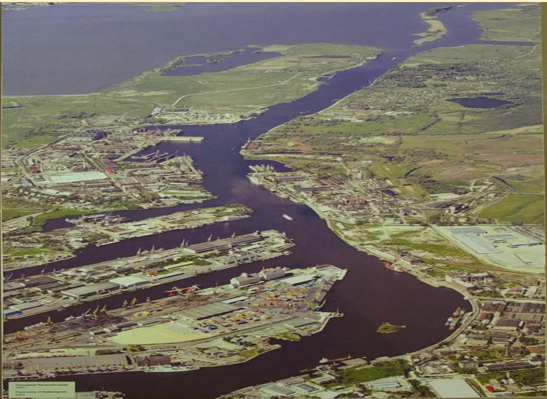
Складские помещения 2002 г. Районеры и Жилищники 2002 г.