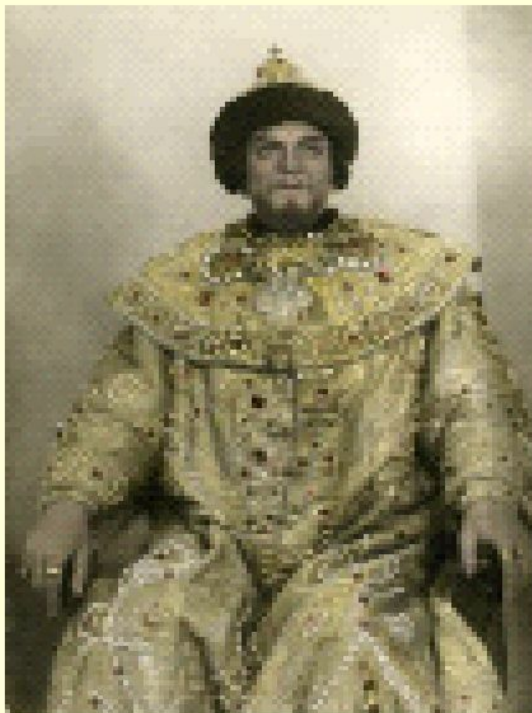
Шапка Мономаха – царский венец