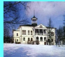
Дом-музей в Карабихе

Именно из Грешнёва Некрасов-поэт вынес исключительную чуткость к чужому страданию. В Грешнёве завязалась сердечная привязанность Некрасова к русскому крестьянину, определившая впоследствии исключительную народность его творчества.