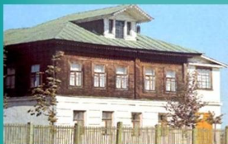
Музыкантская в Грешнево

В 1824 году семья Некрасовых переехала в Грешнево, где и прошло детство будущего поэта. Детские годы оставили глубокий след в сознании Некрасова. Здесь он впервые столкнулся с разными сторонами жизни народа, здесь был свидетелем жестоких проявлений крепостничества: бедности, насилия, произвола, унижения человеческого достоинства.