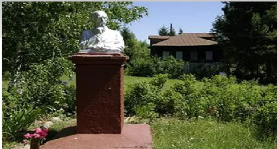
Памятник Н.А.Некрасову в Грешнево