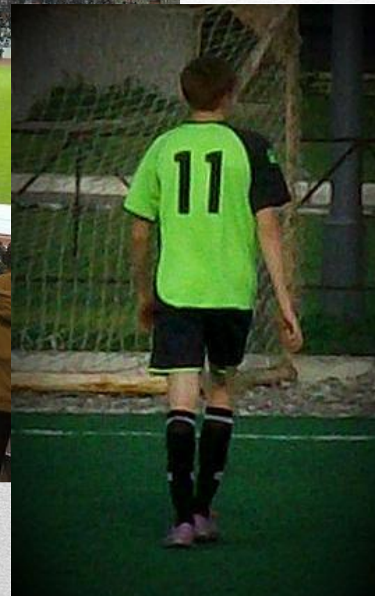
ЦЕНТРАЛЬНЫЙ СТАДИОН г. Екатеринбурга.