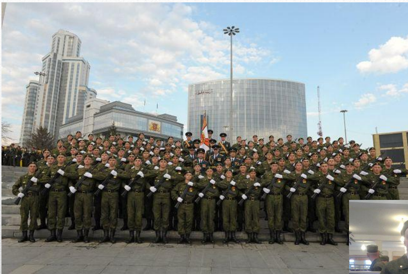
Парад 9 Мая в Екатеринбурге