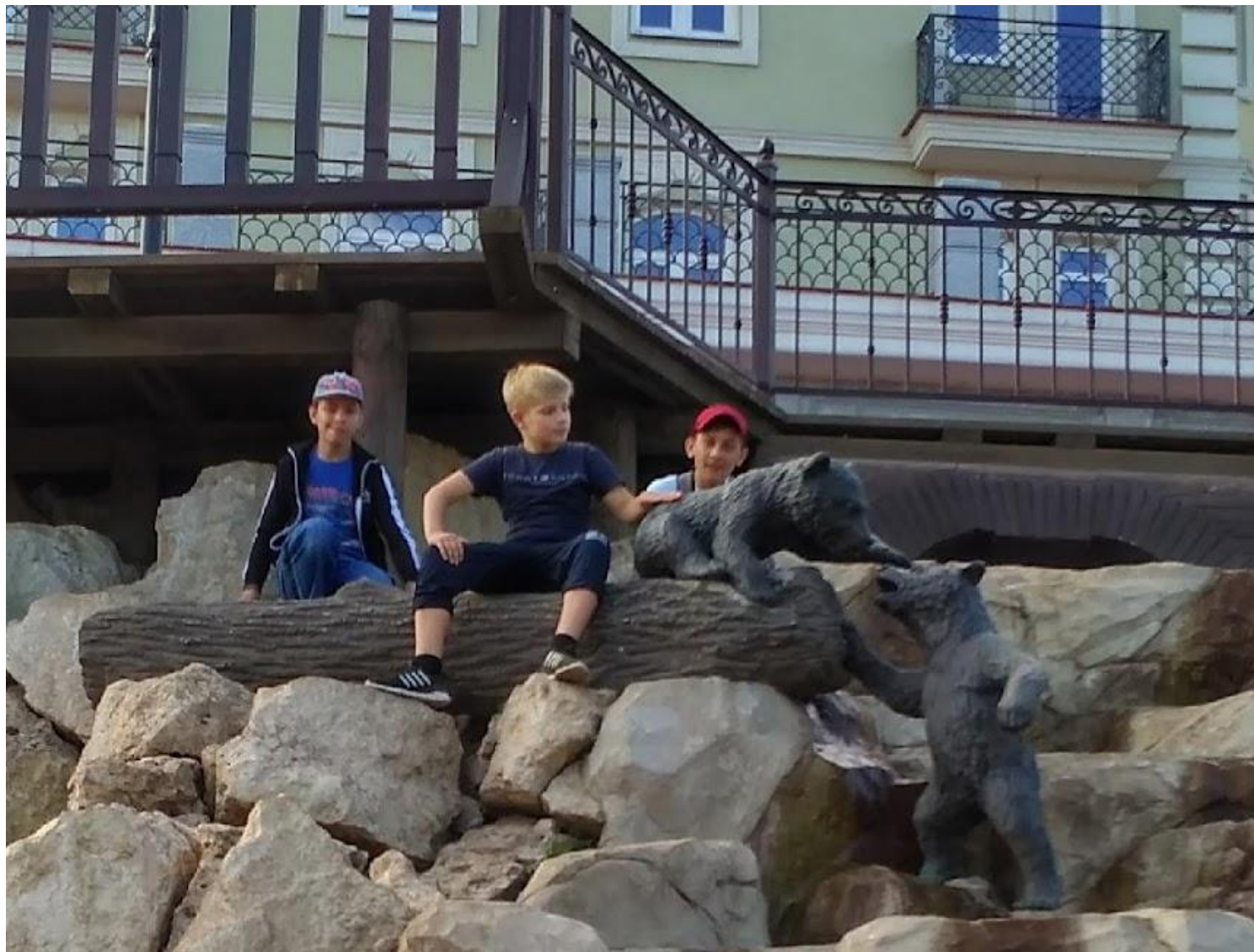
Праволыбедский бульвар около отеля «Старый город»