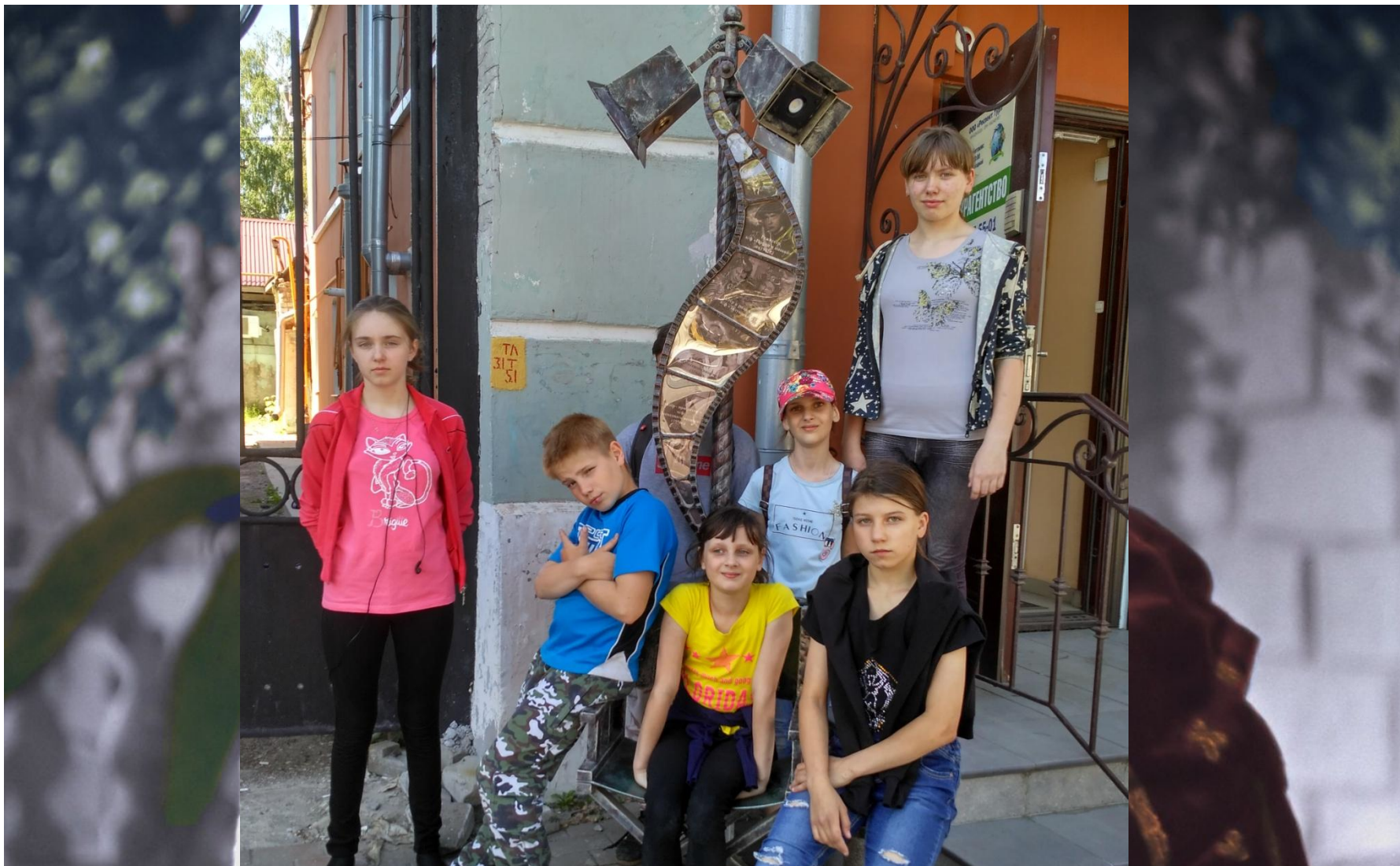
Дом известного актёра и режиссёра Эраста Гарина Адрес: ул. Соборная, 38