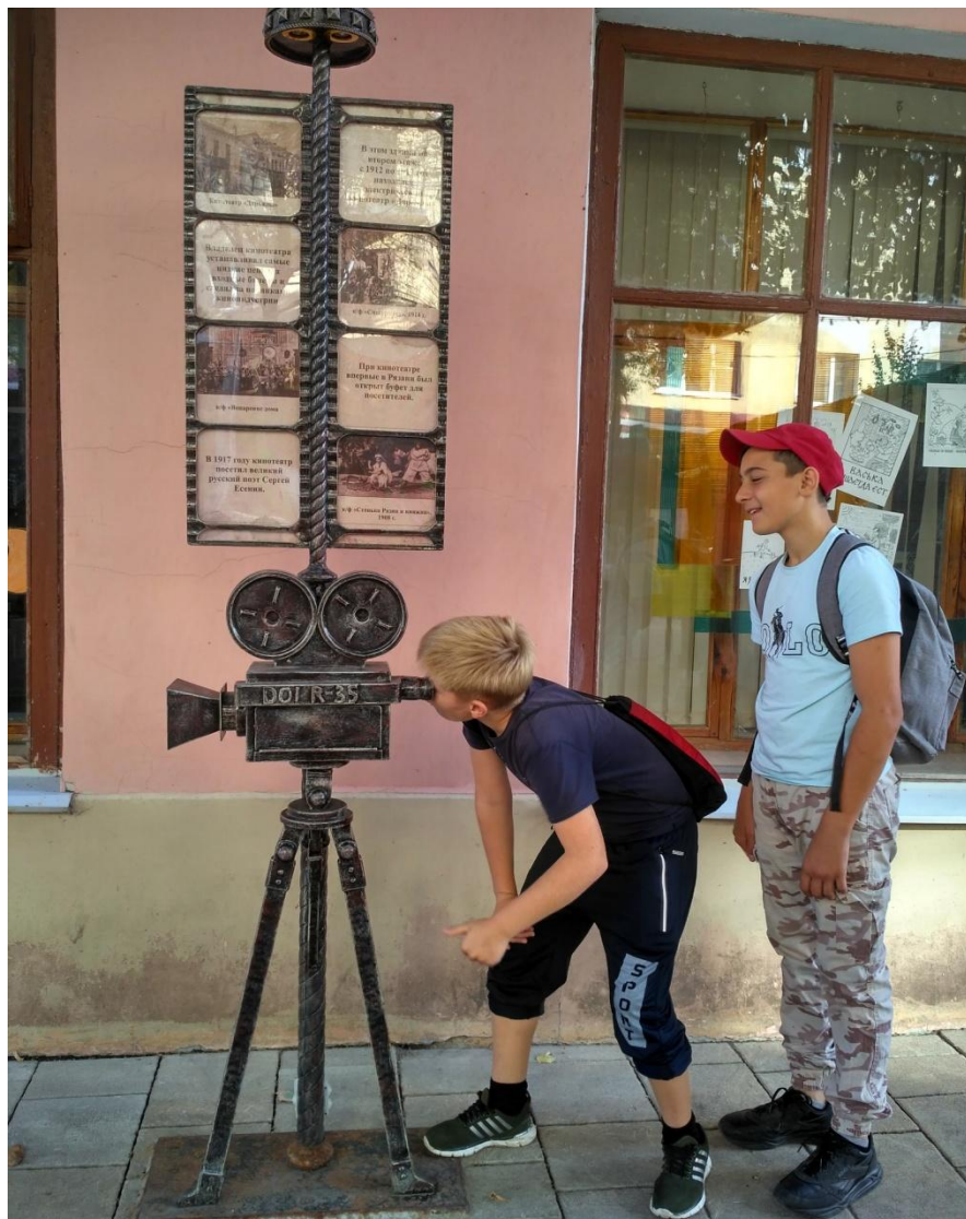
Кинотеатр «Дарьялы» Адрес: ул. Почтовая, 63