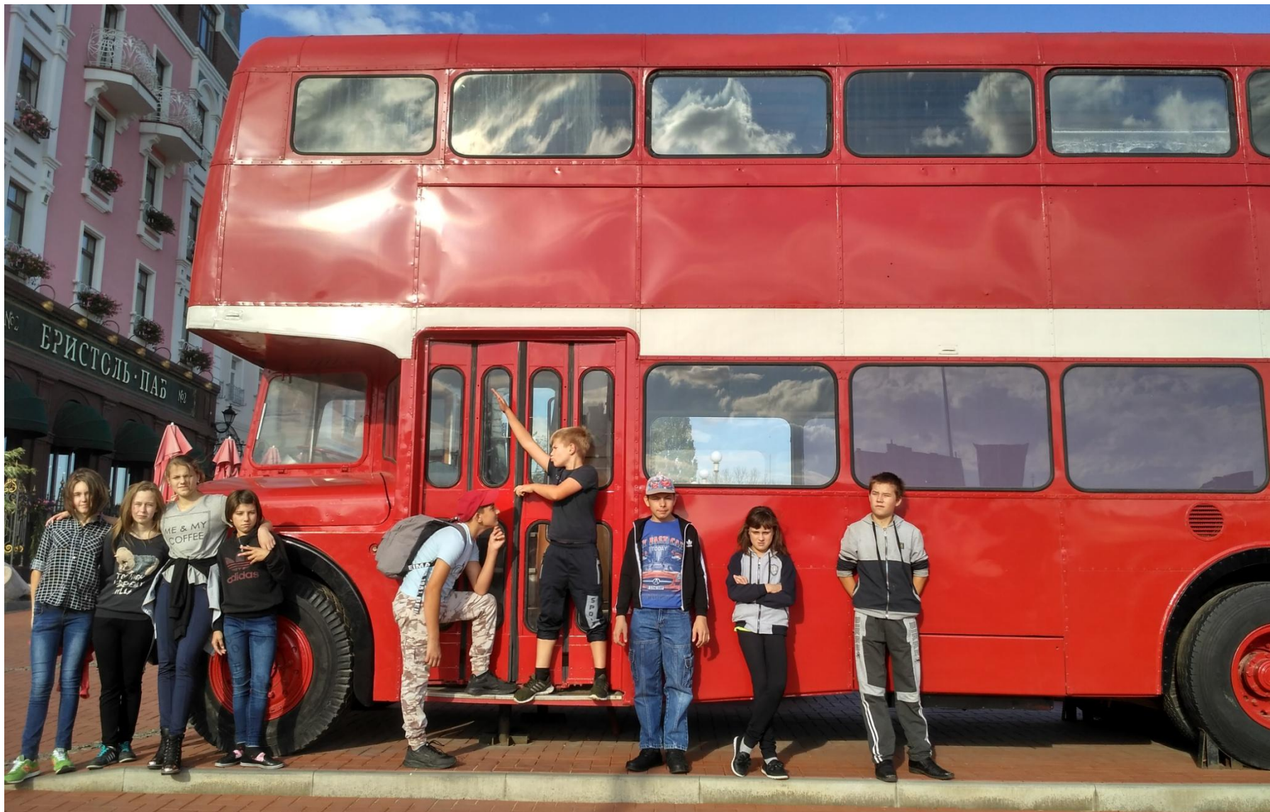
Праволыбедский бульвар около отеля «Старый город»